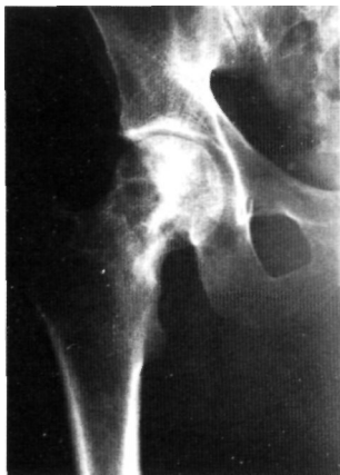
Fig. 4. Estudio radiográfico de la cadera derecha obtenido a los 4 años del tratamiento quirúrgico.

y repetitivas sobre el hueso, que superan la capacidad reparadora del sistema esquelético (3, 4).