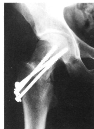
Fig. 2. Estudio radiográfico practicado tras la intervención quirúrgica.