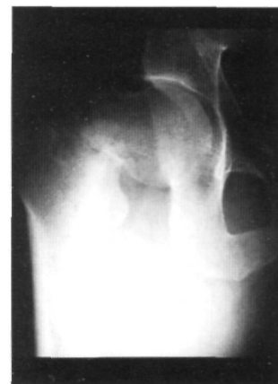
Fig. 1. Radiografía en proyección A-P de cadera derecha que muestra la fractura desplazada del cuello femoral.

Sin embargo, este proceso de remodelación es insuficiente frente a la aplicación reiterada de cargas elevadas, que aunque no superen el límite de elasticidad del hueso, por su aplicación constante son capaces de generar microfracturas trabeculares. Cuando esto ocurre, la inflamación en la zona de fractura provoca dolor y posibilita su detección mediante un estudio gammagráfico (18). Trabajos recientes han sugerido que niveles bajos de un estrés repetitivo en el hueso normal, conducen a un incremento de la remodelación ósea y dan como resultado una osteoporosis localizada que debilita el hueso (2,3,26). Las microfracturas por sobrecarga pueden ser un estímulo normal para producir nuevo tejido óseo, allá donde exista una mayor necesidad, para aumentar la resistencia del hueso como respuesta al ejercicio (16). Estas fracturas ocurren como resultado de sobrecargas cíclicas