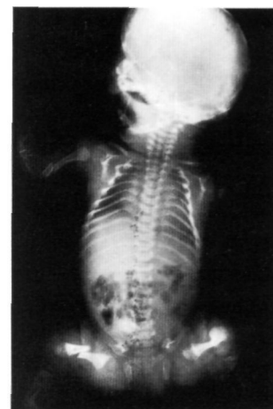
Fig. 1. Radiografía de un recién nacido donde se observan múltiples fracturas (fémures, tibias, húmero, clavícula y costillas). Diagnosticado de osteogénesis imperfecta tipo III.

Para la clasificación de los enfermos se utilizaron los criterios establecidos por Silience (1,2), así como los propuestos por Saphiro (3), (tabla 1) y que correspondieron: 12 al tipo I; 6 al tipo II; 7 al tipo III y 1 al tipo IV. No se han podido revisar otros posibles casos del tipo IV ya que suponen una forma generalmente más benigna de la enfermedad, que cursa con escleróticas de color normal y cuyos sínto-