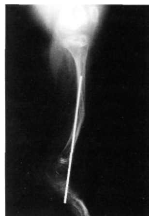
Fig. 7. Radiografía lateral de tibia donde se observa migración de la aguja endomolecular

Siendo extremadamente raras las formas que corresponden al tipo III (8), sorprende que en nuestra serie los casos diagnosticados supongan un 26.9 % del total. Ha sido en este grupo de pacientes en el que se ha concentrado la mayor necesidad de cirugía