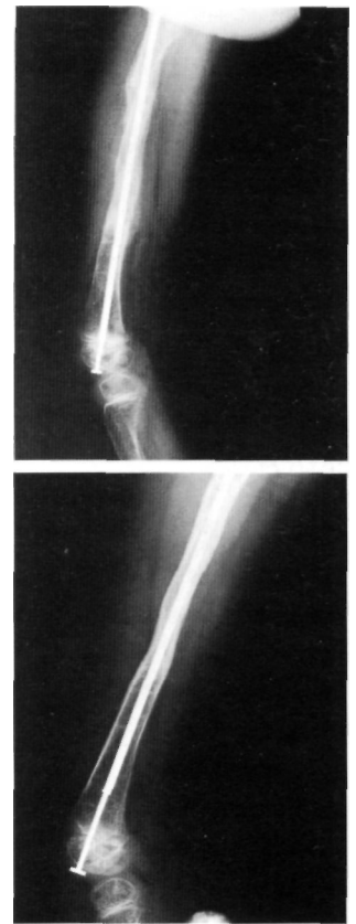
Fig. 4 A v B. Ejemplo de enclavado intramedular mediante clavo telescopado. Alargamiento del fémur con tres años de evolución. Nótese que tras el alargamiento el extremo del clavo permanece en la epifisis.

En el segundo grupo (tipo III) se realizó la mayor cantidad de intervenciones quirúrgicas. En los casos más severos, los enclavados fueron necesarios para evitar las continuas fracturas que se producían en el manejo diario del paciente, a pesar de las extremadas precauciones adoptadas por la familia. No se observaron complicaciones anestésicas ni postoperatorias inmediatas en relación con la enfermedad. No se precisó vigilancia intensiva postoperatoria. Todos los pacientes precisaron reintervenciones en un plazo de tres o cuatro años para efectuar un recambio de la aguja intramedular (12), bien por la desproporción creada por el crecimiento longitudinal del hueso con la consiguiente pérdida de protección, o por emigración proximal o distal de la misma, o por la progresiva protusión transcortical desde su extremo inferior en el punto en que se inicia una deformidad angular ósea por microfracturas subclínicas.