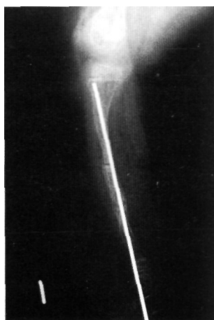
Fig. 3. Radiografía lateral de tibia en la que se realizó doble osteotomía correctora. Fijación de tobillo y articulación talocalcánea.

mas son de aparición más tardía y de menor intensidad.