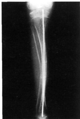
Fig. 2. Radiografía A-P de tibia con enclavado profiláctico mediante aguja de Kirschner y doble osteotomía para alineación. Obsérvese que las fisas están rebasadas por la osteosíntesis.