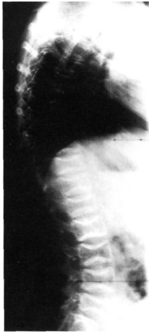
Fig. 6. Radiografía lateral de columna donde se constata la existencia de aplastamientos vertebrales. Platyspondilia.

Debido a la frecuencia con que se produce emigración de las agujas endomedulares (Fig. 7), o que, con el crecimiento corporal, se van produciendo angulaciones por microfracturas en el extremo de las agujas, que en ocasiones llegan a hacerse superficiales, y protuir debajo de la piel (13,14,12), en cinco enfermos han sido precisas varias operaciones de enclavijamiento endomedular de los miembros inferiores, (mínimo de tres, máximo de siete, en cuatro tiempos quirúrgicos distintos, en los que debido al reducido diámetro de la cavidad medular han sido sólo posibles en los primeros años de vida utilizando clavos de Roux finos o agujas de Kirschner del calibre más pequeño. Entre una y tres osteotomías, en cada procedimiento quirúrgico, han sido necesarias para poder alinear satisfactoriamente la extremidad. En la mayor parte de los casos se precisó atravesar una o ambas fisis (Fig. 2), para conseguir la máxima protección en longitud del hueso y para reducir la posibilidad de angulación evolutiva a partir del