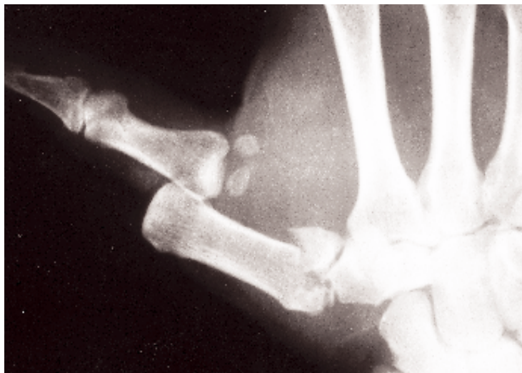
Figura 1. Fractura de Bennett con luxación metacarpofalángica palmar del pulgar asociada.