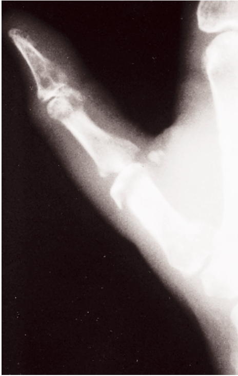
Figura 3. Destrucción de la articulación metacarpofalángica.