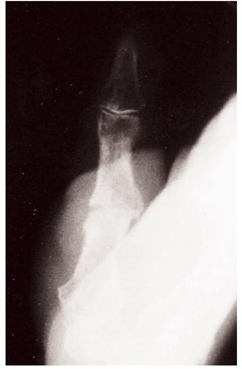
Figura 5. Consolidación de la artrodesis 11 semanas después.

dicha articulación y produjo posteriormente la fractura de Bennett.