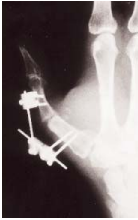
Figura 4. Artrodesis con un fijador externo.