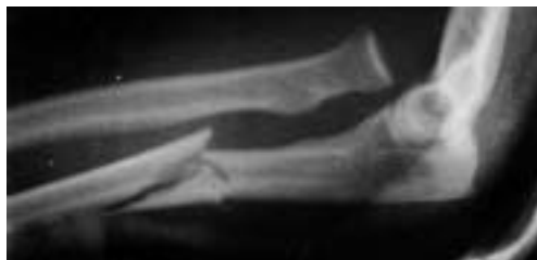
Figura 1. Radiografía en proyección lateral de codo que pone de manifiesto una fractura-luxación de Monteggia tipo I de Bado.

Resultados. No se registraron complicaciones de la herida (infecciones, necrosis, dehiscencias) en ninguno de los casos intervenidos quirúrgicamente. 5 de los casos presentaron lesiones neurológicas en el momento del traumatismo: 2 neuroapraxias de la rama motora del radial que se recuperaron espontáneamente, una parálisis del nervio interóseo anterior que también evolucionó a la recuperación total y una lesión parcial de plexo braquial del lado homolateral que evolucionó al restablecimiento total de la función. El caso restante presentó una parálisis del nervio cubital que no tendió a recuperarse de forma satisfactoria, y cuyo resultado final fue malo. Durante la evolución se registraron 2 retardos de consolidación del cúbito. Ambos casos se presentaron en pacientes que fueron tratados de forma diferida (a los 8 y 10 días respectivamente). En uno de los casos, la lesión era de tipo IV y fue tratada con dos placas. El otro caso, se trataba de una fractura abierta grado II de cúbito (lesión tipo I de Bado), que fue tratado con una osteosíntesis provisional con una aguja que posteriormente fue cambiada por una placa DCP. Siete pacientes presentaron una subluxación