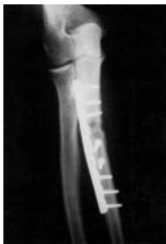
Figura 2. Examen radiográfico en proyecciones A-P y lateral que muestra el tratamiento quirúrgico de una lesión tipo I de Bado