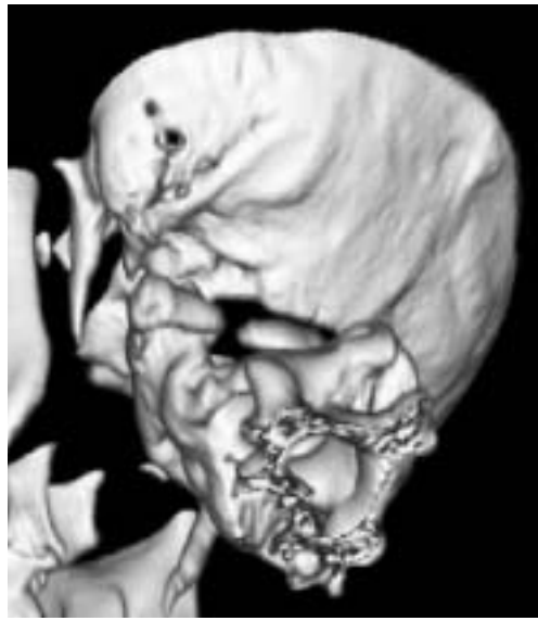
Figura 4. Caso 2: imagen de TAC con reconstrucción 3D.

ción subsiguiente. Este hecho ha sido respaldado por los hallazgos, en autopsias y en quirófano, de tejido conectivo que une el defecto óseo (9,10).