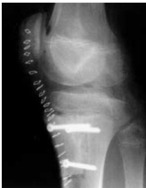
Figura 3. Radiografía postoperatoria.

En este momento se remitió a nuestro centro para completar estudio y tratamiento. Se realizó una resección local amplia con reconstrucción con homoinjerto criopreservado atornillado sobre base esponjosa (Fig. 3). El diagnóstico anatomopatológico se planteó como “tumor pseudomaligno de hueso simulando osteosarcoma”. La valoración del aspecto del osteoide encontrado que no se consideró se tratase de osteoide tumoral maligno, así como las características histológicas del tumor con la existencia de figuras mitóticas, células en empalizada, células gigantes, hueso trabecular e islas de cartílago algunas de las cuales forman placas de cartílago epifisario, permitiría etiquetarlo