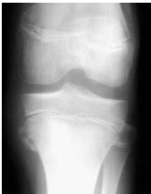
Figura 1. Radiografía simple inicial.