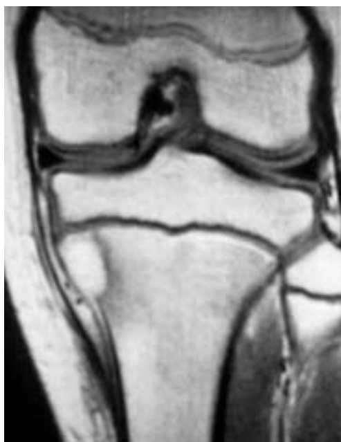
Figura 2. R.M.N. inicial.

analítica la cifra de fosfatasas alcalinas era 487. Tras punción biopsia inicial que planteaba el diagnóstico diferencial quiste óseo aneurismático/osteoblastoma, se realizó una biopsia excisional intralesional y relleno con hueso liofilizado. El estudio anatomopatológico de esta pieza fue informado compatible con “osteosarcoma típico convencional intramedular con gran componente de células gigantes y pequeños focos condrales”.