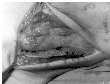
Figura 3. Imagen tras anudar los puntos transóseos e inicio del cierre de la vaina con puntos sueltos.

inicialmente diagnosticados de esguince de tobillo y tratados mediante una férula posterior durante tres semanas.