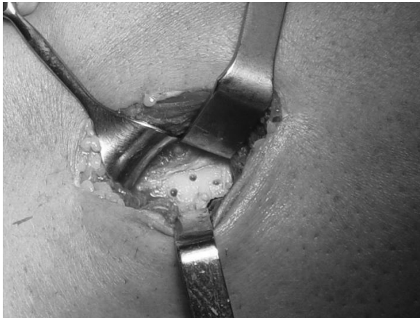
Figura 4. Orificios unicorticales en la tuberosidad bicipital del radio.