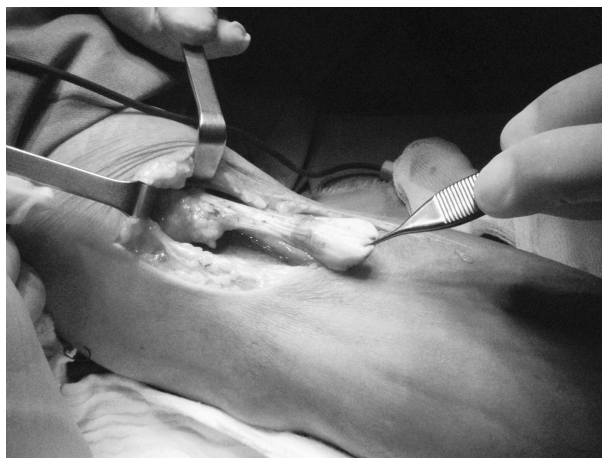
Figura 3. Muñón del tendón bicipital avulsionado.

Tras localizar y regularizar el muñón del tendón bicipital (Fig. 3), se procede a la preparación de la sutura (no reabsorbible). Se pasan las mismas con una disector