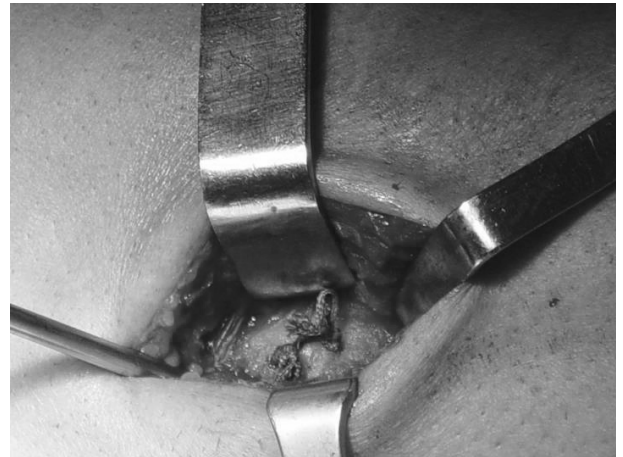
Figura 5. Suturas transóseas anudadas.

romo curvo muy próximo al radio hacia la zona posterolateral del antebrazo, evitando exponer la superficie perióstica del cúbito proximal, con el fin de evitar la formación de sinostosis radio-cubital. Por medio de una incisión en la zona de la salida del disector, abordamos y preparamos el lecho receptor en la tuberosidad del radio con una fresa de alta velocidad y realizamos tres orificios monocorticales a dicho nivel en distintos planos para minimizar el riesgo de fracturas, orificios por los que pasamos y anudamos las suturas del tendón (Fig. 4 y 5).