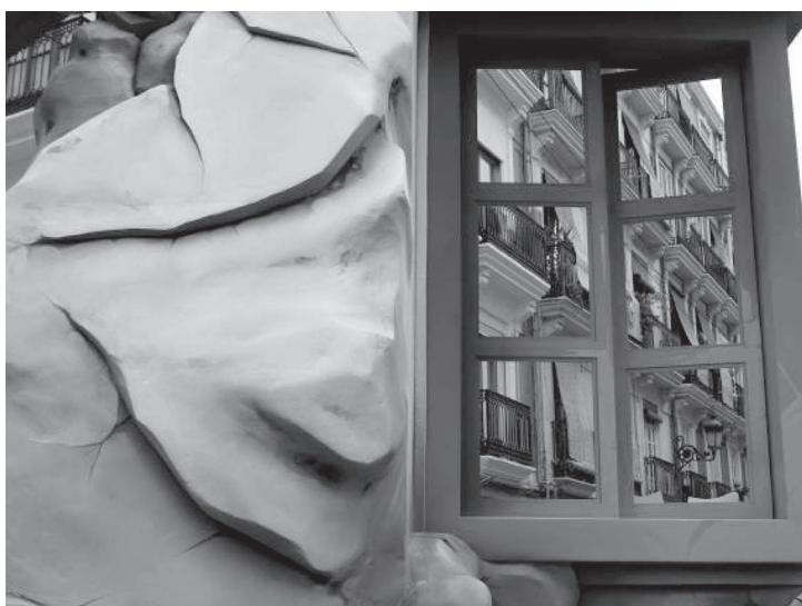
Les finestres de la façana de la falla de Borrull-Túria.