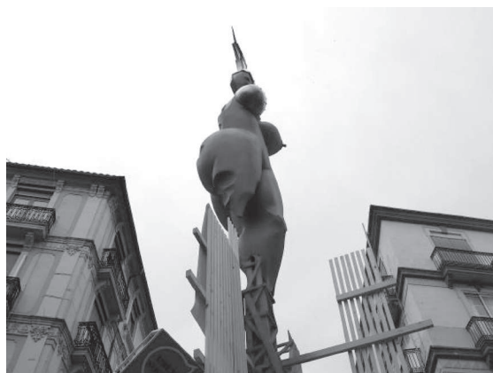
Personatge principal de la falla de Borrull-Socors, obra de l'artista Daniel Jiménez Zafrilla.

ment, però amb un concepte tremendament diferent, i igualment interessant. Una immensa figura que recorda la Venus de Willendorf destaca, pintada de roig, al damunt d'una mínima columna que la sustenta. L'altura de diuït metres del monument resulta impactant, ja que en una trama ortogonal de carrers és possible veure-la des d'una distància considerable. Aquesta flama roja enclavada enmig de les teulades del barri sembla un estendard que ens recorda la importància de la temàtica abordada. Cal destacar, oportunament, que la comissió fallera de Borrull-Socors fa ja uns anys que treballa al voltant de les òperes wagnerianes, tot incidint, en cada ocasió, en una temàtica diferent. Enguany s'han centrat en els drets de les dones, i l'òpera al·lusiva és La valquíria . Les valquíries són importants personatges femenins de la mitologia escandinava. Eren guerreres de gran fortalesa, que tenien com a funció fonamental acompanyar els herois caiguts al Valhalla, per guarir-los de les ferides. La més coneguda pel gran públic és Brunilde, gràcies a l'òpera de Wagner L'anell dels Nibelungs , i més recentment a la pel·lícula Django Unchained , del director Quentin Tarantino.