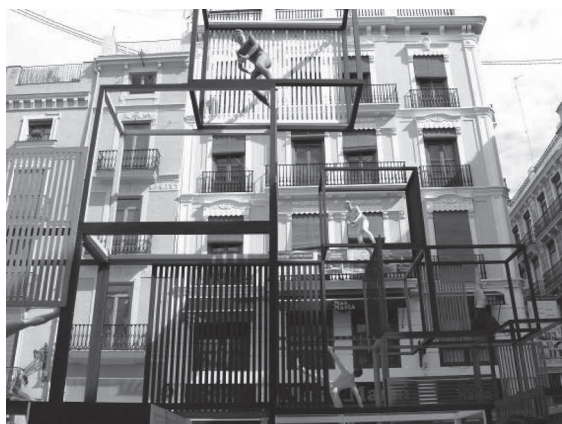
El joc geomètric dels cubs transparents dissenyats per Anna Ruiz es combina de manera radical amb l'arquitectura de la plaça, imprimint transparència.

L'artista va voler deixar espai lliure per al trànsit de les persones, que finalment s'acaben incorporant com a transeünts al mateix monument, ja que les figures (ninots) eren de les dimensions del públic, i per tant combinaven a la perfecció en aquest joc de danses i trànsits entre persones i personatges. Al terra hi ha un enorme tapís groc, sobre el qual trobem textos d'escriptors i comentaris literaris al voltant de la dansa, de les pors i de les visibilitats. El tractament conceptual és sempre molt meticulós en les obres d'Anna Ruiz, artista llicenciada en Belles Arts, que també disposa d'un important bagatge en història de l'art. El seu és més prompte un concepte d'art públic, una pràctica artística dins de l'espai públic, i per tant ens trobem davant d'una mirada que, si bé està immersa en la dinàmica de les falles, ens acosta sigil·losament a la pràctica artística contemporània de caràcter radical. Si voleu més informació de les seues propostes la podeu trobar en l'enllaç < www.flickr.com/photos/anna_ruiz/ >.