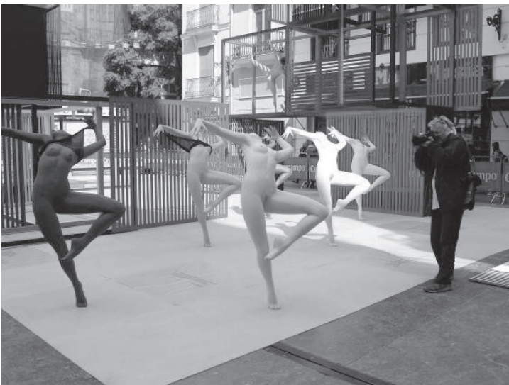
Un dels atractius dels treballs de l'artista Anna Ruiz són les seues figures humanes.

De fet, l'interés de l'obra d'Anna Ruiz té nombroses lectures i encaixos. El tractament de l'espai ha sigut agosarat i rotund. Estàvem acostumats durant dècades a entrar a la plaça de la Mercé per descobrir un monument estranyament opac, incorporat a les escasses dimensions de la plaça de manera excessiva. Per contra, en la proposta d'Anna Ruiz el que ens ha sorprès és la transparència, la llum, la respiració d'un espai que ara se'ns ha mostrat més lliure, menys oprimat, més diàfan, i sobretot més actual per la seua proposta estètica. La construcció del monument de la Mercé per part d'Anna Ruiz suposava trencar radicalment els esquemes del públic. No perdem de vista que estem parlant d'una falla que tradicionalment ha estat en la secció especial, i que està situada geogràficament just al costat mateix de la falla de l'Ajuntament, la qual cosa suposa una afluència extraordinària de públic i visitants. Precisament la utilització d'aquest agosarat ritme espacial i conceptual ens ajuda a comprendre que estem davant d'un veritable projecte innovador, experimental i arriscat, molt proper a una proposta d'intervenció en l'espai públic, i significativament llunyà del que l'espectador podria entendre com una falla convencional.