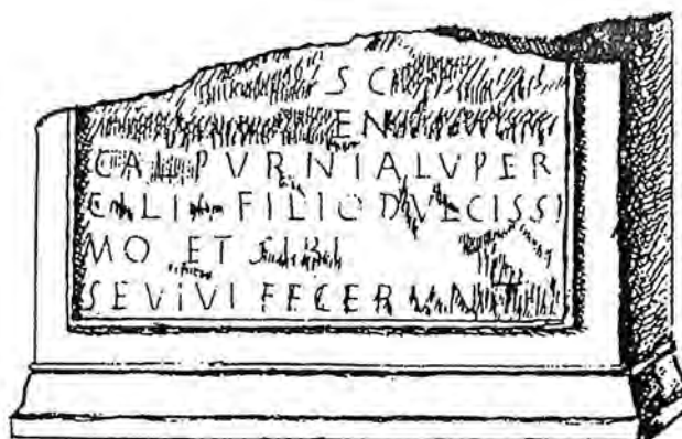
Figura 4. Segons el manuscrit de Valcárcel (1852).

Com ja va assenyalar Corell, no és fàcil establir la lectura d'aquesta inscripció fragmentària, desapareguda i transmesa amb diverses variants. Només la font anònima de Cortés i Seguer la van veure completa: el primer la representa sencera, però només amb el text inserit en un rectangle (Fig. 2), i el segon partida en dos fragments, però amb la forma del suport ben detallada (Fig. 3). El dibuix de Seguer ens ha arribat a través de tres còpies: una de Sales, que al seu torn copia Ribelles, i l'altra de Valcárcel, qui només va poder veure la part inferior (Fig. 4). Els quatre dibuixos presenten diferències entre si, que augmenten en les edicions posteriors de l'epígraf, i fins i tot afecten al número de ratlles: si en les quatre còpies assenyalades el text té vuit ratlles, en l'edició de Delgado de l'obra de Valcárcel en té nou, que Hübner amplia en el CIL II fins a deu. De més a més, hi ha una diferència entre els dos dibuixos de Valcárcel que representen la inscripció: en el que representa la meitat inferior que ell pogué veure directament figura la r. 6, que no apareix en el que la representa sencera, com ja va assenyalar Hübner. La lectura de les 4 primeres ratlles, entre les quals es troben les més danyades (2-4), ha donat peu a diverses