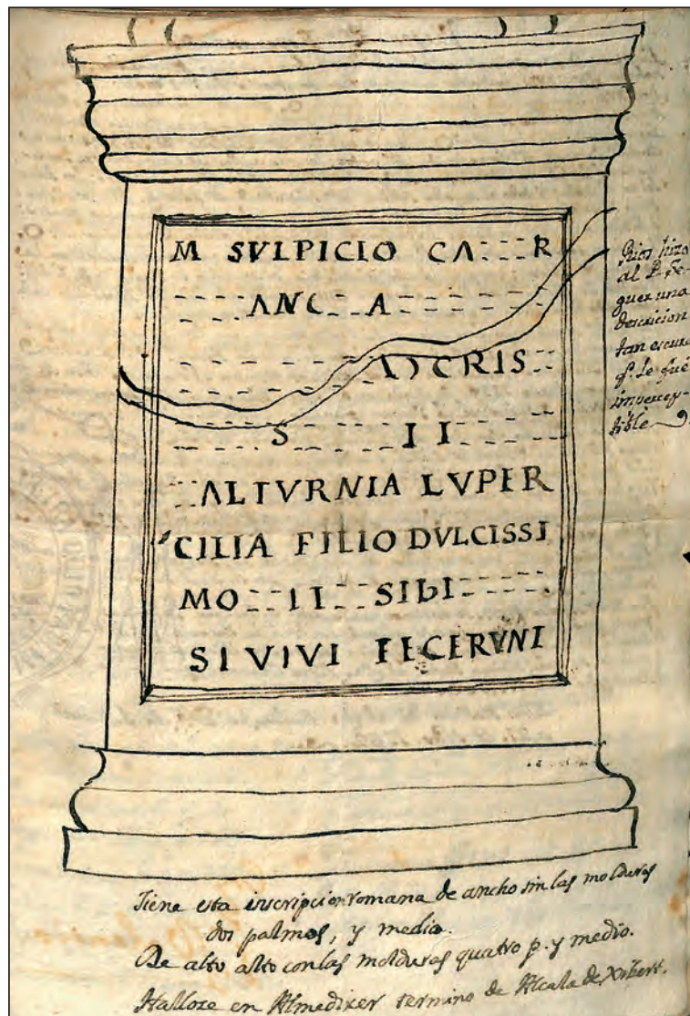
Figura 3. Segons el manuscrit de Sales (ca. 1760).

veure anys més tard el també cronista de València B. Ribelles, que va incloure la inscripció en la seua obra manuscrita sobre les inscripcions valencianes (Fig. 3). Possiblement en 1790 la inscripció va ser vista per A. Valcárcel, que la va incloure en la seua obra manuscrita sobre les antiguitats valencianes, enviada a la RAH en 1805 i editada per Delgado en 1852 (Fig. 4). Valcárcel li va comunicar la troballa a J. F. Masdeu en carta del 22 de febrer de 1790, que la va incloure en dos volums de la seua obra. Aquests són els testimonis més pròxims a la troballa; les referències posteriors provenen totes de les obres publicades, singularment de la de Valcárcel, fins que Corell va consultar els manuscrits de Sales i Ribelles per a la confecció del seu corpus epigràfic . La inscripció, doncs, compta amb una llarga llista de referències arxivístiques i bibliogràfiques, i