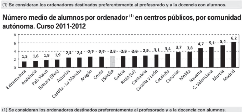
FIGURA 1. ORDENADORES EN CENTROS PÚBLICOS (MECD, 2013)

De modo que las reacciones a la iniciativa Escuela 2.0, como cabía esperar, fueron muy diversas y motivadas por razones diferentes. El signo político de