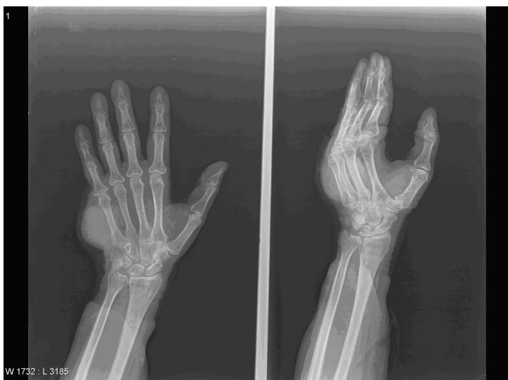
Figura 3. Radiografía de mano izquierda. Se aprecia tumoración de partes blandas en eminencia hipotenar en contacto con el V metacarpiano.

parecidas, y a veces su histología, cuando tienen un tratamiento y pronóstico totalmente diferente. Sobre todo cuando se presentan como la primera manifestación de la enfermedad 7 , aunque en ninguno de nuestros casos esto ocurrió, ya que se trataba de, en el primer caso la metástasis apareció precozmente a los pocos meses de la extirpación del tumor primitivo, y en el otro caso apareció varios años después, hecho frecuente en este tipo de metástasis 7 .