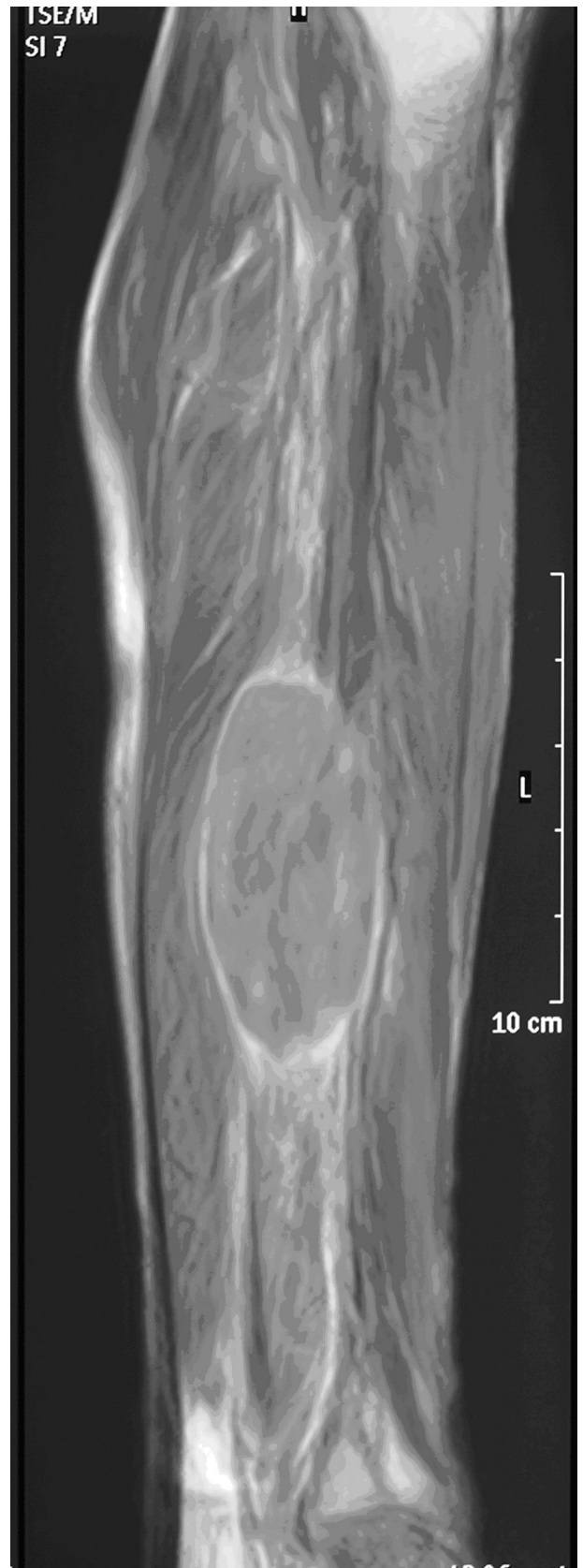
Figura 2. Imagen de resonancia magnética. Secuencia T-1. Corte sagital, se aprecia lesión fusiforme heterogénea intramuscular.

A pesar de su extrañeza, hay que tenerlos en cuenta para realizar un diagnóstico diferencial ante una masa de partes blandas, ya que se pueden confundir con los sarcomas de partes blandas, no solamente por la clínica, sino también porque las pruebas de imagen son muy