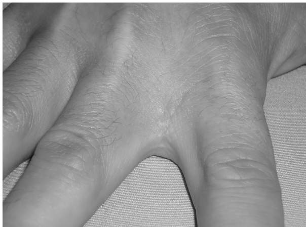
Figura 5. Segundo espacio interdigital en la actualidad, diez años después, sin lesión recidivante.