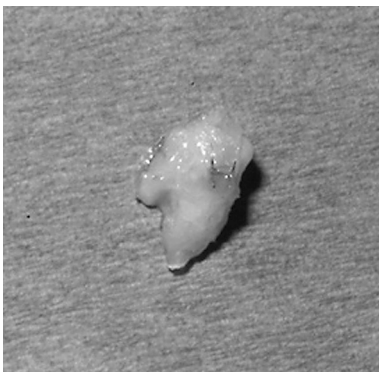
Figura 3. Pieza quirúrgica reseca, aspecto macroscópico.