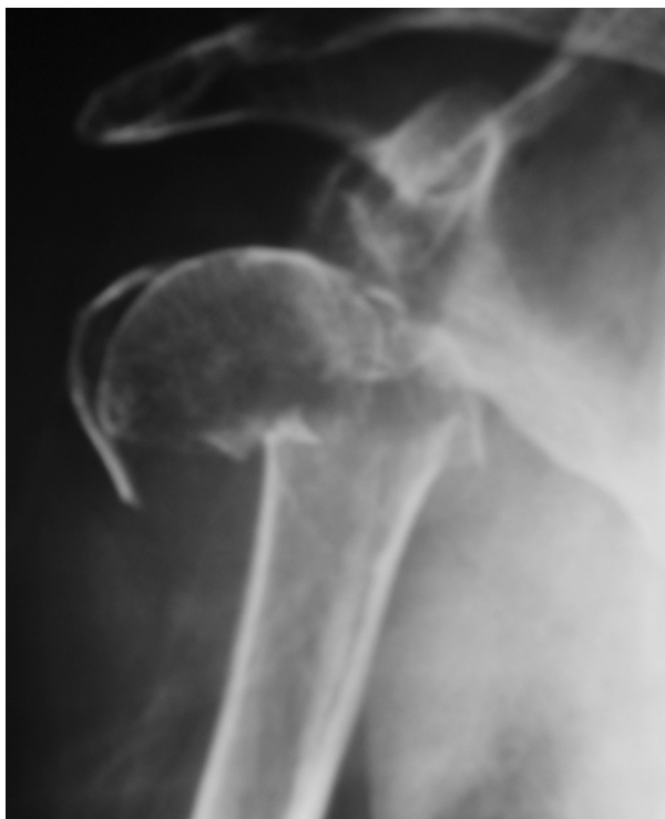
Figura 2. Fractura tipo C2 de hombro derecho con desplazamiento en valgo y bisagra medial superior a los 2 mm.

en 6 casos (10,7%) (Fig. 5), lesión del nervio circunflejo en 3 casos (5,4%), consolidación viciosa de las tuberosidades en 4 casos (7,1%), hundimiento de la prótesis en un caso (1,8%) (Fig. 6), ascenso de la cabeza protésica en 12 casos (21,4%) (Figs. 4 y 7) y luxación de la prótesis