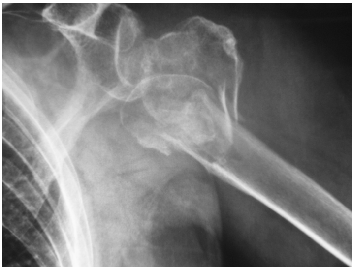
Figura 1. Fractura tipo C3 de hombro izquierdo.

Al analizar las complicaciones detectadas, éstas fueron observadas en 21 de los casos (37,5%), no encontrándose ninguna de ellas en los 35 restantes (62,5%) (Fig. 3). Se ha apreciado reducción del espacio subacromial durante el período evolutivo con la correspondiente sintomatología de síndrome subacromial en 9 de los casos (16,1%) (Fig. 4), reabsorción de las tuberosidades