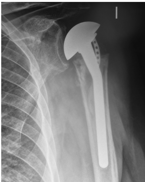
Figura 5. Reabsorción de las tuberosidades durante el período evolutivo de una hemiartroplastia de hombro izquierdo.