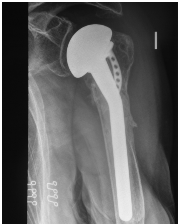
Figura 8. Consolidación correcta de las tuberosidades en una hemiartroplastia de hombro izquierdo.

en 1 caso (1,8%). No se observó ningún caso de infección postoperatoria.