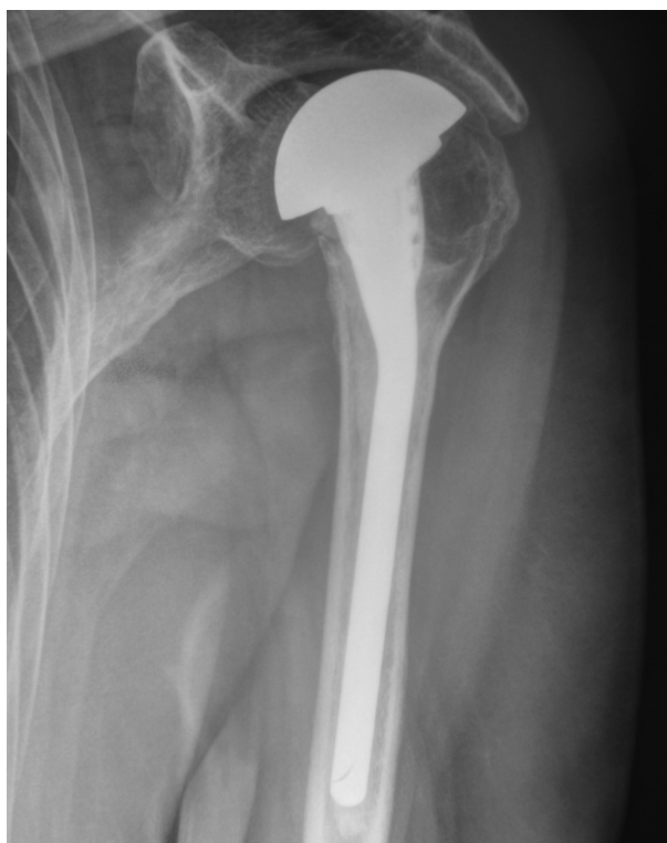
Figura 4. Control radiográfico de hemiartroplastia de hombro izquierdo en el que se aprecia una reducción del espacio subacromial secundario a un ascenso de la cabeza protésica.