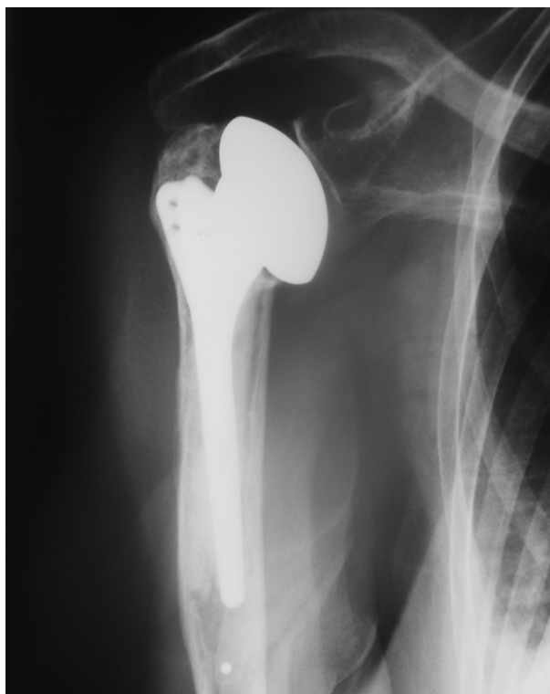
Figura 6. Hundimiento protésico en una hemiartroplastia de hombro derecho.