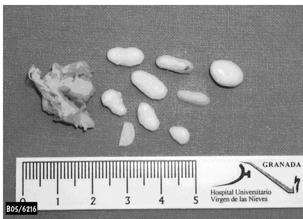
Figura 2. Imagen de la pieza histológica reseca en la que se observa la membrana sinovial y los condrocitos.