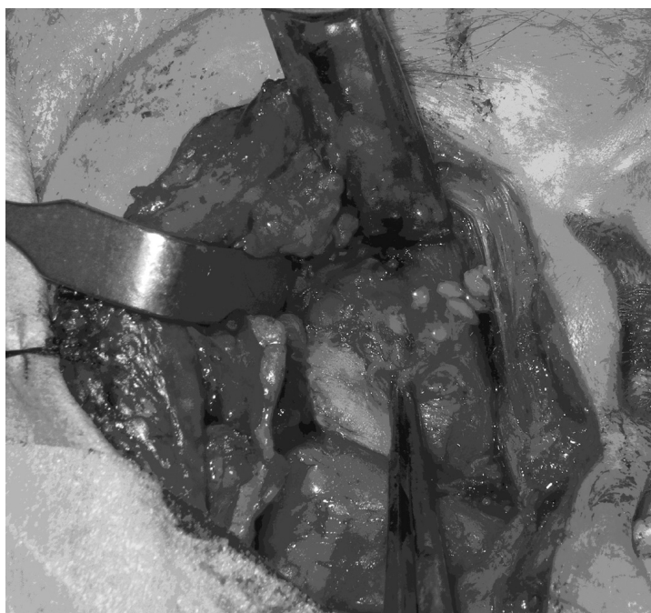
Figura 4. Imagen macroscópica intraoperatoria donde se aprecia la salida de cuerpos libres intraarticulares (condrolitos) de la articulación temporomandibular.

La CS es una patología que presenta mayor incidencia en el sexo masculino que en el femenino 7 . En contra-