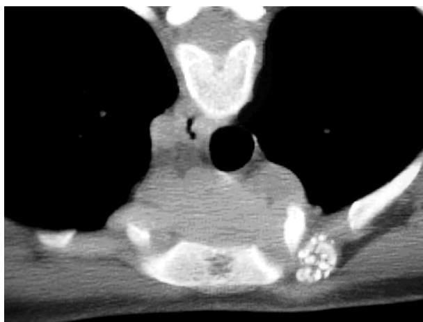
Figura 1. Imagen TC (corte axial). Se observa la presencia de nódulos cartilaginosos a nivel de la articulación esternoclavicular izquierda.