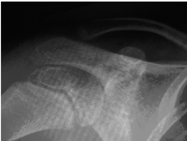
Figura 1: radiografía simple del hombro izquierdo. No se aprecia ninguna lesión ósea.

Para completar el estudio realizamos una TAC donde se demostró una lesión lítica de 7 mm, radioluciente y con refuerzo central de densidad calcio, compatible con OO.