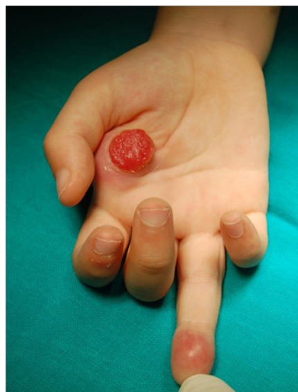
Figura 1. Lesión exocítica eritematosa en la palma de la mano, es el granuloma piógeno secundario a la biopsia sobre fibroma. En 4º dedo se aprecia también lesión nodular eritematosa sobre pulpejo.

Ante este hallazgo, resulta obligado ampliar el diagnóstico, a fin de descartar una entidad conocida como Miofibromatosis infantil , descrita por Enzinger 1 en