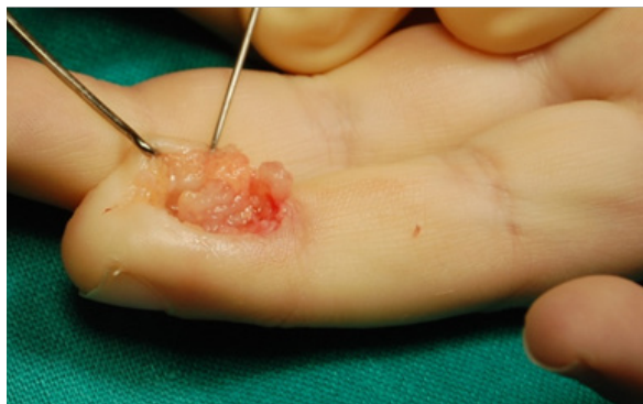
Figura 4. Tejido característico de fibromatosis en 4º dedo. La resección es dificultosa debido a su déficit de cápsula y rodeando a paquetes colaterales.

Las Rx no suelen aportar información, puesto que la mayoría son normales. La ecografía permite evaluar la profundidad de la lesión. Sin embargo, es la RM la