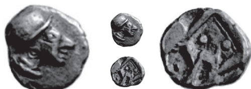
Fig. 3 / Euc. 3

Or, ces mêmes auteurs font un judicieux rapport typologique entre la monnaie 1 et un spécimen plus lourd présent dans le trésor d'Auriol : OBA-UNI (L) ( Fig.