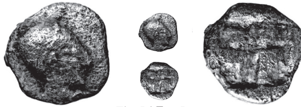
Fig. 5 / Εκ. 5

Le deuxième ( Fig. 5 ), actuellement conservé à la BnF (BN 506, 1,00 g) fut trouvé avant 1846 lors de la construction du nouveau port de Marseille, à la Tourette 9 . Son faible état de conservation peut expliquer son poids léger. Ses caractéristiques, avec une tête à droite traitée à l'identique de la monnaie 4 (même coin ?) et un grand carré creux quadripartite de revers, ne laissent aucun doute sur la filiation entre ces deux spécimens.