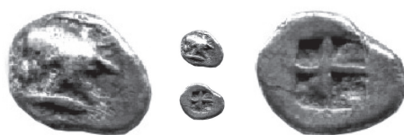
Fig. 2 / Euc. 2

On peut y détailler une tête féminine à droite coiffée d'un reste de bonnet non perlé avec un profil aux traits particulièrement grossiers et une ligne de cou très prononcée et, au revers, le typique carré creux empuritain à large croix centrale 3 . Cette divisionnaire, la plus légère de la phase A archaïque d'Emporion, que nous datons de vers 500 av. J.-C., correspond pondéralement au 1/64 e du statère phocaïque (poids théorique aux alentours de 0,17 g).