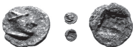
Fig. 1 / Euc. 1

En 2011, M. Feugère et M. Py 1 publient dans leur Dictionnaire sous la référence OBB-25 un petit module (0,16 g) trouvé près de Marseille (Baou-Roux) ( Fig. 1 ) dont les spécificités correspondent parfaitement à un spécimen empuritain ( Fig. 2 ) que nous venons de mettre en lumière 2 dans notre récent travail sur le monnayage archaïque d'Emporion (XI. Female head, n° 29, 0,19 g, 5-6 mm).