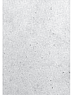
2281 Fv (fotografía no disponible)