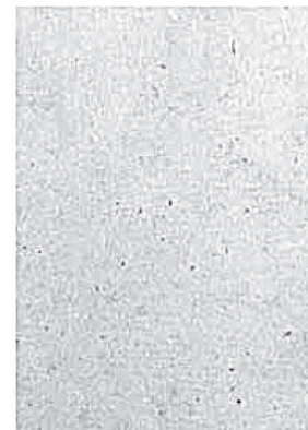
2265 Fv (vacía)

La numeración antigua llega hasta esta última hoja