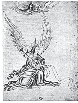
XCIII (2273 Fr)