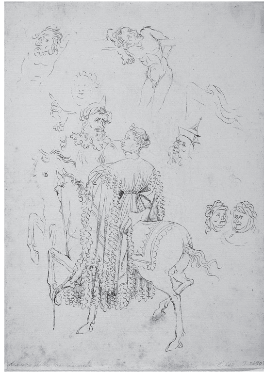
Fig. 3. Inv. 2270 Fv (numeración original, VII verso).

presar de modo claro, con otras y mejores palabras, y en la voz de una autoridad, lo que se ha ido poniendo de manifiesto a lo largo de este estudio sobre el cuaderno de los Uffizi: el carácter verdaderamente transnacional del arte del 1400, también en lo que se refiere a este ejemplo, tan cercano al medio artístico valenciano. Desde esta perspectiva, no importa tanto la identidad concreta de los diferentes dibujantes que utilizaron sus hojas como el valor del conjunto como demostración evidente del contacto de la pintura valenciana con el arte foráneo. Dada su innegable cohesión como volumen (que se ha argumentado por extenso antes), es la prueba material más rotunda del componente extranjero en este ámbito de la práctica artística en Valencia, aunque hasta ahora no haya sido posible determinar con certeza quiénes trabajaron en este sorprendente carnet de dessins .