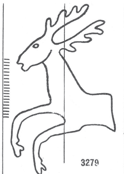
Fig. 1. Filigrana del cuaderno.

será "de la forma segons es haia deboixat en un full de paper toscà"; 19 en 1404 aparecen folios de "paper toscà de la forma major i menor" en el inventario del apotecari Raimon Amalrich, junto a