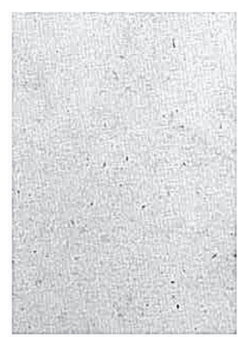
2264 Fv (vacía)