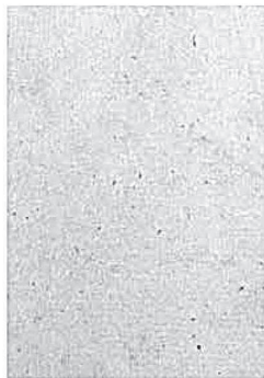
2276 Fv (vacía)