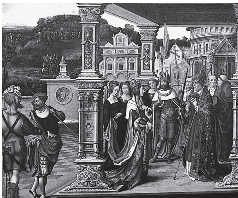
Fig. 5. Bernard van Orley, Sainte Hélène devant le Pape , Bruxelles, Musées royaux des Beaux-Arts de Belgique.

chargé faisant alterner pilastres moulurés et candélabres sculptés. En réalité, à l'exception de cette coquille monumentale issue du répertoire de Jean Gossart, toute la structure qui s'élève à l'arrière-plan du tableau de Madrid a bien été bâtie dans l'esprit de Bernard van Orley. La décoration lourde qui habille l'édifice est très caractéristique du maître bruxellois qui, quelques années avant 1520, se plaît à surcharger d'ornementations lombardes chaque élément structurel du décor. Les candélabres qui rythment l'intérieur de l'abside sont fréquemment employés par Van Orley pour tapisser les faces panneautées des piliers. C'est sous cette forme qu'ils apparaissent dans la Nomination de cavalier de saint Martin par l'Empereur Constantin 57 et, surtout après 1515, dans le volet gauche du Retable de la Sainte-Croix 58 (fig. 5), l' Annonciation 59 de Cambridge et Romulus et Rémus apportant la tête d'Amulius à Numitor . Les pilastres qui encadrent strictement l'abside présentent, quant à eux, quelques similitudes avec les piliers extravagants élevés à l'entrée de la maison du patriarche Iduméen sans pour autant en at-