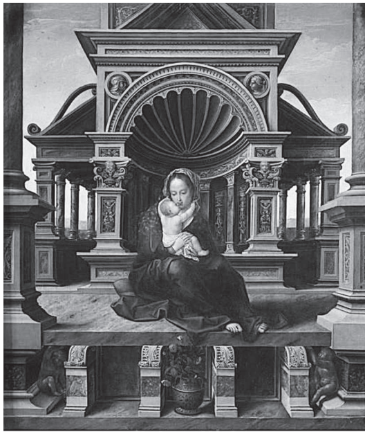
Fig. 1. Bernard van Orley, Madone de Louvain , Madrid, Museo Nacional del Prado.

terme desquelles la paternité de l'œuvre fut révisée pour être finalement donnée au peintre bruxellois Bernard van Orley. 4 Entre les partisans du Maubeugeois et ceux du Bruxellois, il était à vrai dire difficile de trouver un terrain d'entente. Aux yeux des premiers, le style du décor architectural supposait l'intervention de Gossart qui, après avoir séjourné à Rome en 1509 en compagnie de l'amiral Philippe de Bourgogne, 5 avait cherché à "italianiser" la peinture flamande héritée des "Primitifs" du XV e siècle, en introduisant notamment dans ses panneaux des architectures inspirées de l'Antiquité et de la Renais-