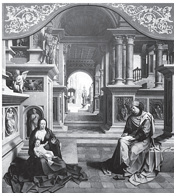
Fig. 4. Jean Gossart, Saint Luc dessinant la Vierge , Prague, Narodní Galerie.

du Prado semble revendiquer "l'intervention" de Jean Gossart. Celui-ci n'en est pourtant pas l'auteur. Connaissant ses goûts en matière d'architecture, c'est différemment que Mabuse aurait composé l'abside s'il en avait eu l'occasion. Suivant un canevas diffusé en Italie par l'architecte Bramante, il l'aurait probablement fait précéder d'une voûte à caissons comme c'est le cas dans le dans le Saint Luc et les volets du Triptyque Salamanca . 54 Aussi, pour habiller la paroi, il aurait certainement choisi une marqueterie entrecoupée de supports – identique à celle d' Hercule et Déjanire , 55 des panneaux latéraux de Toledo ou du Portrait de l'Homme au rosaire 56 plutôt que ce décor