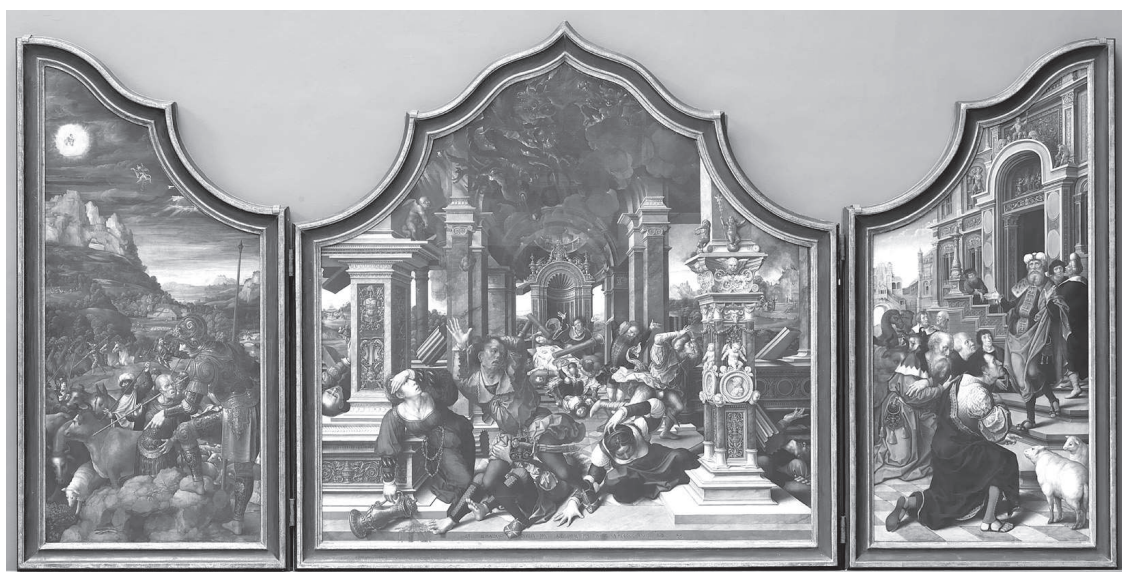
Fig. 3. Bernard van Orley, Retable des épreuves et de la patience de Job, Bruxelles, Musées royaux des Beaux-Arts de Belgique.

(fig. 3) de 1521 et le dessin Romulus instaurant les lois 41 de 1524 n'offrent qu'une version lointaine de celle proposée dans la Madone de Louvain : les piliers fantaisistes de la maison de Job et les colonnes monumentales du palais du roi romain ne s'érigent pas le long des côtés latéraux du cadre, mais sont placés plus en retrait dans la composition. Par leur vocabulaire, les supports élevés à l'avant-plan dans le panneau du Prado évoquent à la fois le langage de Jean Gossart et celui de Bernard van Orley. Poser une colonne sur un haut piédestal est une pratique que les deux artistes ont fréquemment employée. Le premier en fait usage dans la Vierge à l'Enfant entourée de deux saintes , Vénus et l'Amour , Danaé , etc. Chez le second, on trouve ce motif surtout à partir des années 1520, notamment dans l'Adoration des Mages de Philadelphie et le volet droit du Retable du Jugement dernier , 42 soit autant d'œuvres inspirées directement de l'art de Raphaël. 43 Par le classicisme de leur style (base attique et fût de marbre), ces deux supports pourraient être une citation précise de la colonne posée sur un piédes-