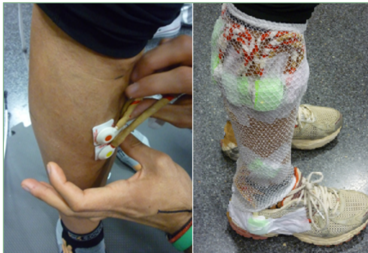
Figura 1. Instrumentación de los electrodos (izquierda) y ejemplo de un corredor completamente instrumentado (derecha).

non-invasive assessment of muscles" 20 (Figura 1).