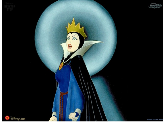
FIGURA 3. Madrastra de la película de Disney Blancanieves , basada en el cuento de los hermanos Grimm.