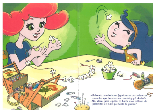
FIGURA 5. Rania, la niña protagonista con su madrastra, Berta.

Kress y Van Leeven (1986) comparan las imágenes anteriores a las que se muestran a continuación. Las figuras 5, 6 y 7 pertenecen al cuento La novia de papá también me quiere .