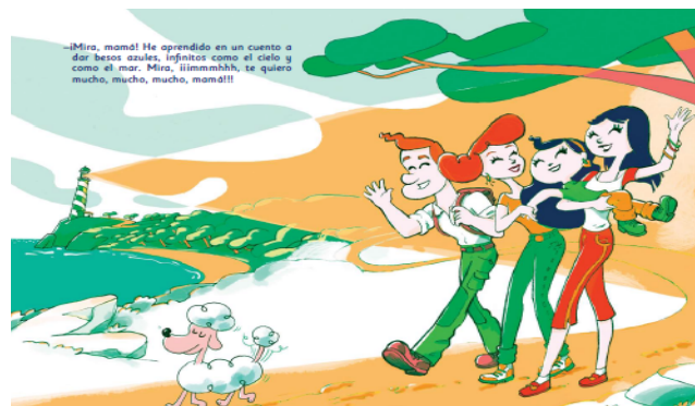
FIGURA 6. Rania con su madre, Claudia, su padre y su madrastra, Berta.