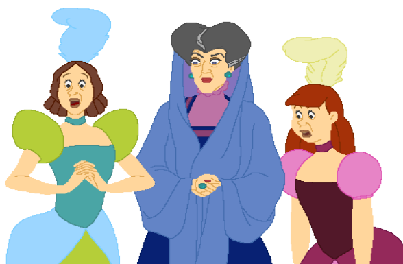
FIGURA 2. Madrastra la película de Disney Cenicienta , basada en el cuento de los hermanos Grimm.

Las imágenes propuestas en la primera fase de esta secuencia didáctica son las que se pueden observar en las figuras 2, 3 y 4: