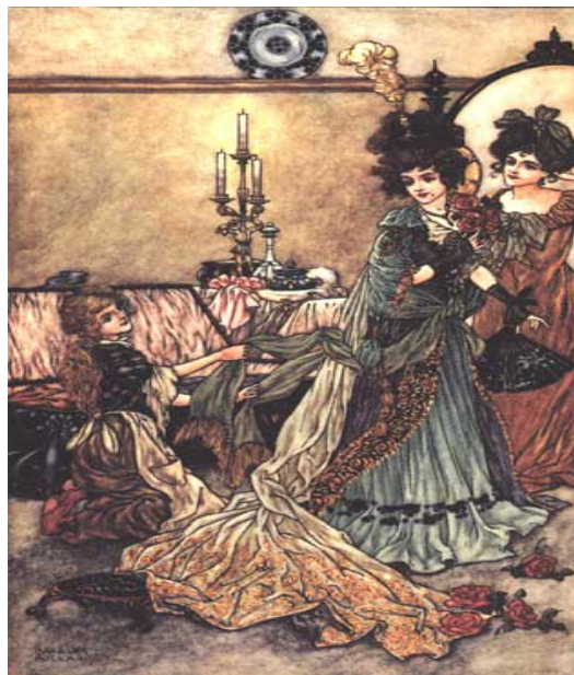
FIGURA 4. Grimm, Jacob and Wilhelm. Grimm's Fairy Tales . Charles Folkard, illustrator. London: Adam and Charles Black, 1911

En el caso de las tres imágenes, el análisis comienza por identificar a los participantes con preguntas del tipo: ¿Quién es esta, y esta...? En el caso de estas imágenes, veremos que en la figura 2 es la madrastra de Blancanieves, en la figura 3, la madrastra y las hermanastras de Cenicienta y en la figura 4 pueden ser la madrastra y una de las hermanastras de Cenicienta (o las dos hermanastras).