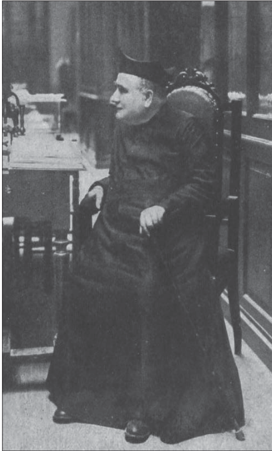
Font: «La Hormiga de oro», 15/6/1912, p. 7. Fotografia de Gómez Durán.

l'encíclica de Lleó XIII (reed. Vicent 1972), De la agremiació dentro y fuera de los círculos católicos obreros (1905), Cooperativismo católico (1906) i Manual de las escuelas de reforma social (1911). Però a més, promogué que la Casa de los Obreros organitzara una biblioteca popular circulant ( El Siglo Futuro , 7/1/1910, núm. 750, pàgina 3, inclou un anunci amb la consigna: « Se trata de la descristianizada Valencia »).