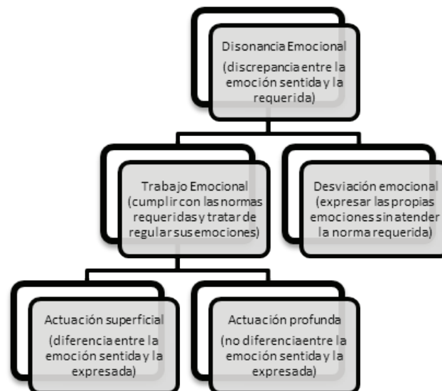
Figura 1. El proceso del trabajo emocional.

También la Teoría de los Eventos Afectivos (Weiss & Cropanzano, 1996) puede explicar este proceso psicosocial. Dicha teoría afirma que los acontecimientos afectivos en el trabajo pueden ayudar a explicar las actitudes y comportamientos de los trabajadores. De este modo, si un evento