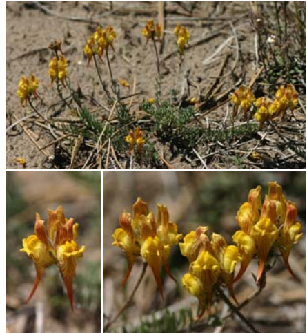
Figura 2. Ejemplar de Linaria depauperata subsp. hegelmaieri de la población valenciana Casa de Pilas (Ayora, Valencia).

a la localidad se comprobó la desaparición, al menos temporal, del taxon. La extinción de la planta en esta localidad, ligada posiblemente a los tratamientos de desbroce a que ha sido sometida toda esta Zona de Actuación Urgente (ZAU) durante estos años, aconseja no incluirla dentro del mapa de distribución por el territorio de la Comunidad Valenciana, quedando así pendiente la exploración y búsqueda en profundidad de la planta en esta área en posteriores campañas. La cohorte de las especies acompañantes era muy semejante a la encontrada en las otras poblaciones ayorenses (Tabla 2), instaladas también sobre un suelo de marcada textura arenosa, aunque de coloración oscura.