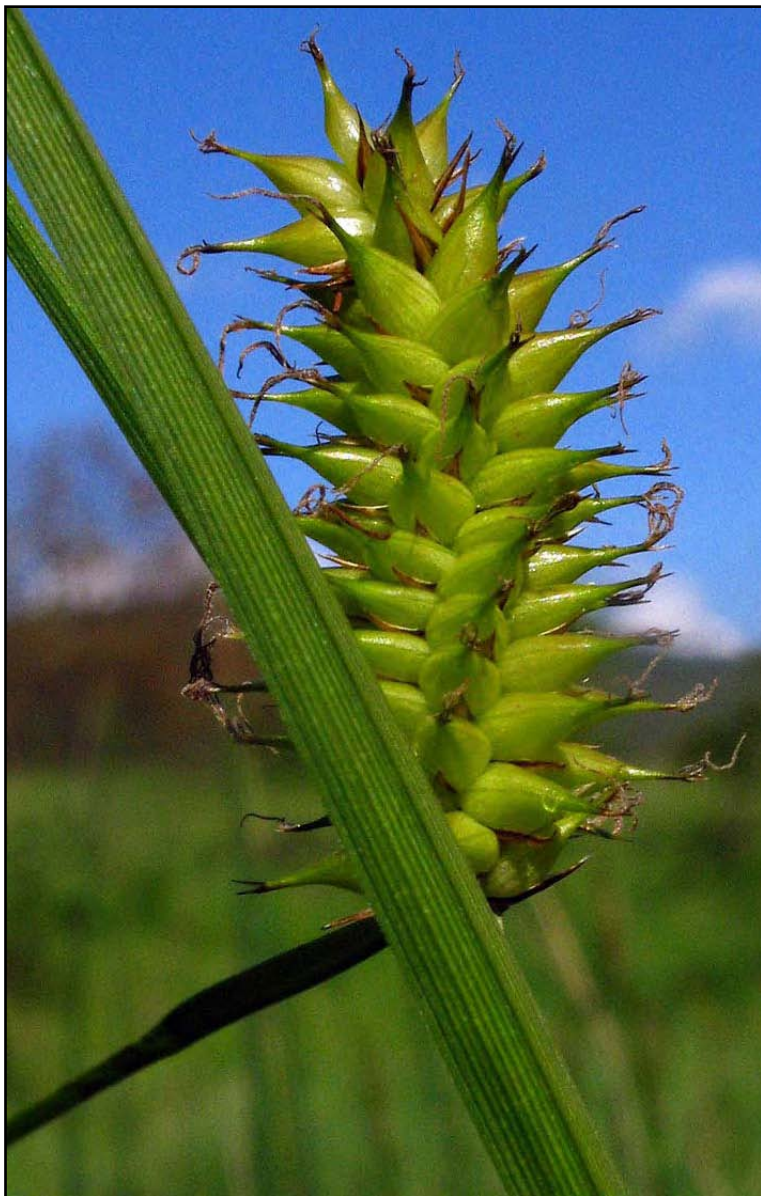
Figura 2. Carex vesicaria , fotografiada en Villa Juanita en mayo de 2006.