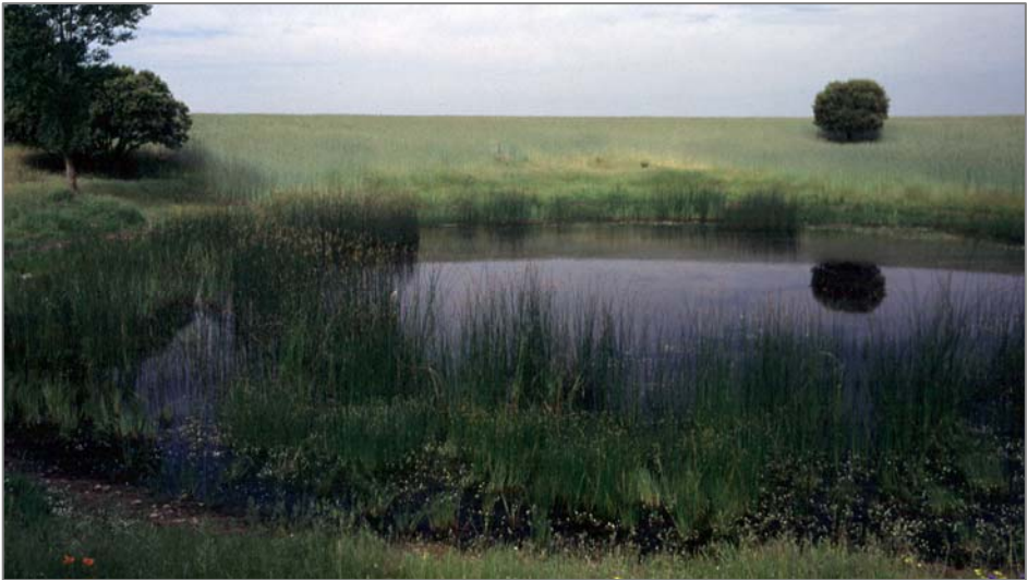
Figura 5. Tardajos de Duero, laguna de Blasco Nuño