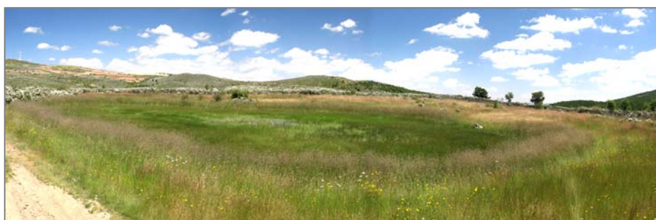
Figura 7. Suellacabras, Laguna El Espino