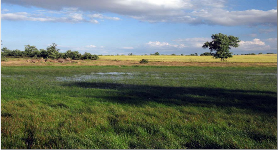
Figura 4. Rabanera del Campo, laguna del Ciego