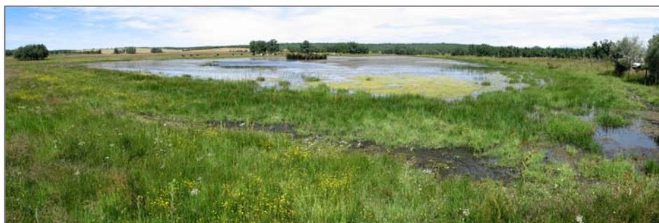
Figura 6. Rabanera del Campo, laguna de la Dehesa