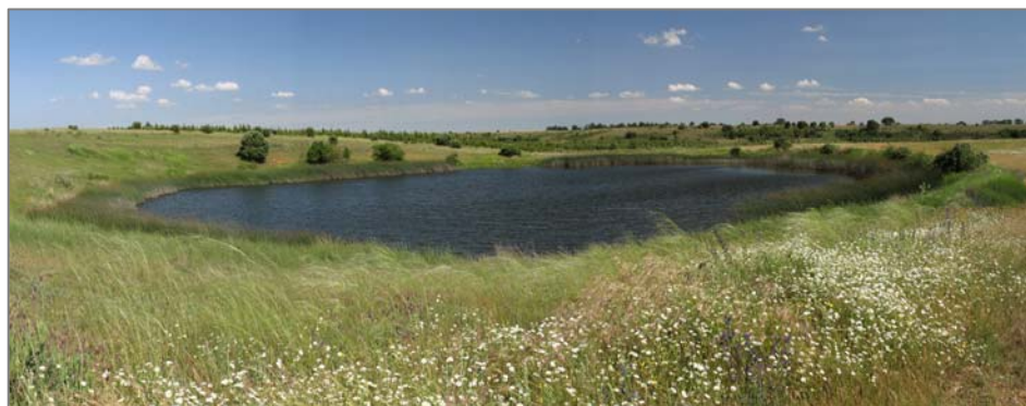
Figura 8. Alconaba, laguna Honda