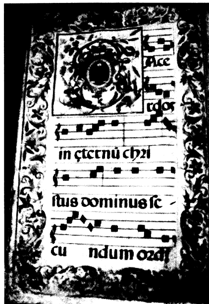
Lámina 3. VAcP-Mus/CM-LC-10. s. XVII