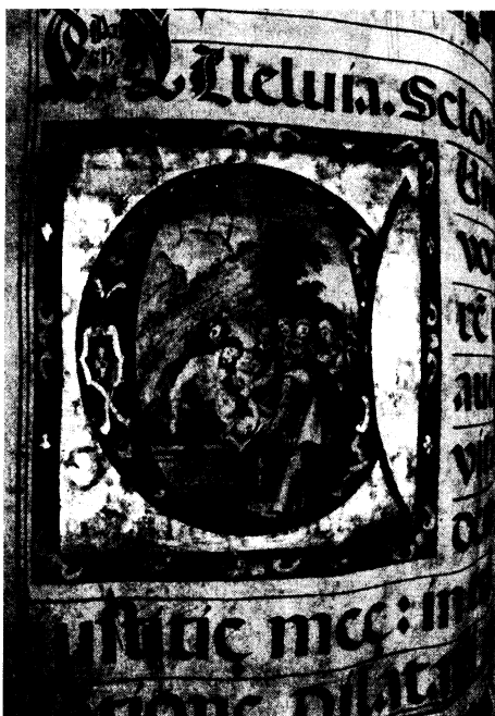
Lámina 1. El entierro de Cristo . Letra capital iluminada. A. VAcp, LC-7, Ms. f. 173.

La mayor parte de la decoración de las letras mudéjares del LC-7 corresponden a motivos vegetales, frutales, geométricos, arabesco y 37 de las casi mil están historiadas y muestran escenas con personas, animales, objetos o paisajes. Hemos seleccionado una que muestra una temática musical con el rey David tocando el arpa (véase lámina 2).