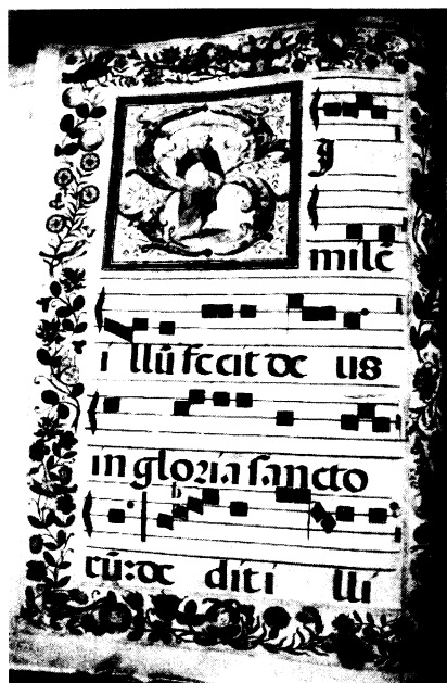
Lámina 5. VAcP-Mus/CM-LC-21.s. XVII.