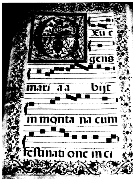
Lámina 4. VAcP-Mus/CM-LC-11. s. XVII.