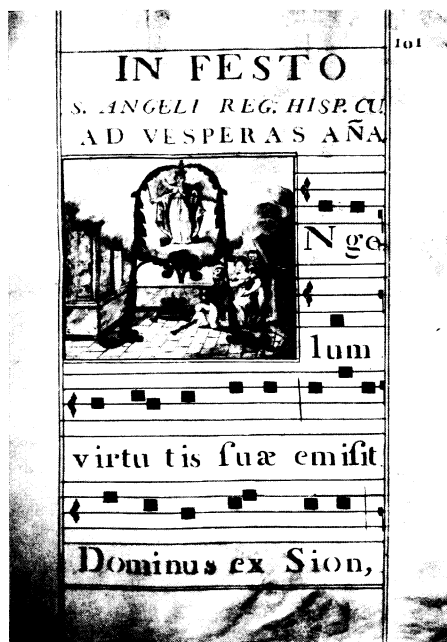
Lámina 6. VAcP--Mus/CM-LC-26. 1863.