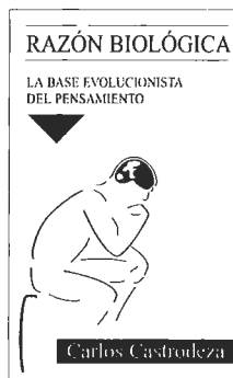
Carlos Castrodeza, Razón biológica. La base evolucionista del pensamiento Minerva, Madrid, 1999, 262 pp.

En tercer y último lugar, la tesis de Castrodeza rompe directamente con el antagonismo de las dos culturas, la humanista y la científica. Su aproximación es próxima a la denominada tercera cultura, muy habitual en los países anglosajones, por ejemplo la que vivamente sostiene Wilson (1998), y que aboga por una reconsideración de la ciencia como instrumento intelectual para el planteamiento y resolución de visiones generales o cosmogónicas. Dicho de otro modo, determinadas teorías científicas compiten con cosmogonías basadas en