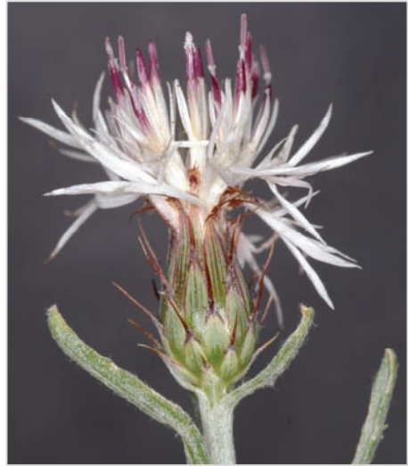
Fig. 1: Detalle de un capítulo de Centaurea resupinata subsp. virens (Tavernes de Valldigna, Valencia).

pinata subsp. virens aparecen identificados como pertenecientes a C. rouyi Coincy, y ulteriormente revisados como C. resupinata subsp. dufourii por G. Blanca y V. Suárez-Santiago para Flora iberica (i.e. VAL 157537; VAL 157536; VAL ex VAB 884208). En este sentido, existen algunas poblaciones cercanas al área de distribución de la subsp. virens (VAL 197624, 5812, 157545 y 165259), que consideramos próximas a la planta de Pau pero que en todos los casos corresponden a la subsp. dufourii .