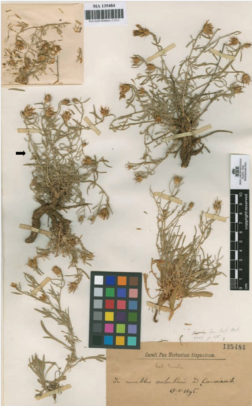
Fig. 3: Lectótipo de Centaurea resupinata subsp. virens (MA 135484), el lectótipo es el ejemplar situado en la parte superior izquierda del pliego (indicado con una flecha).