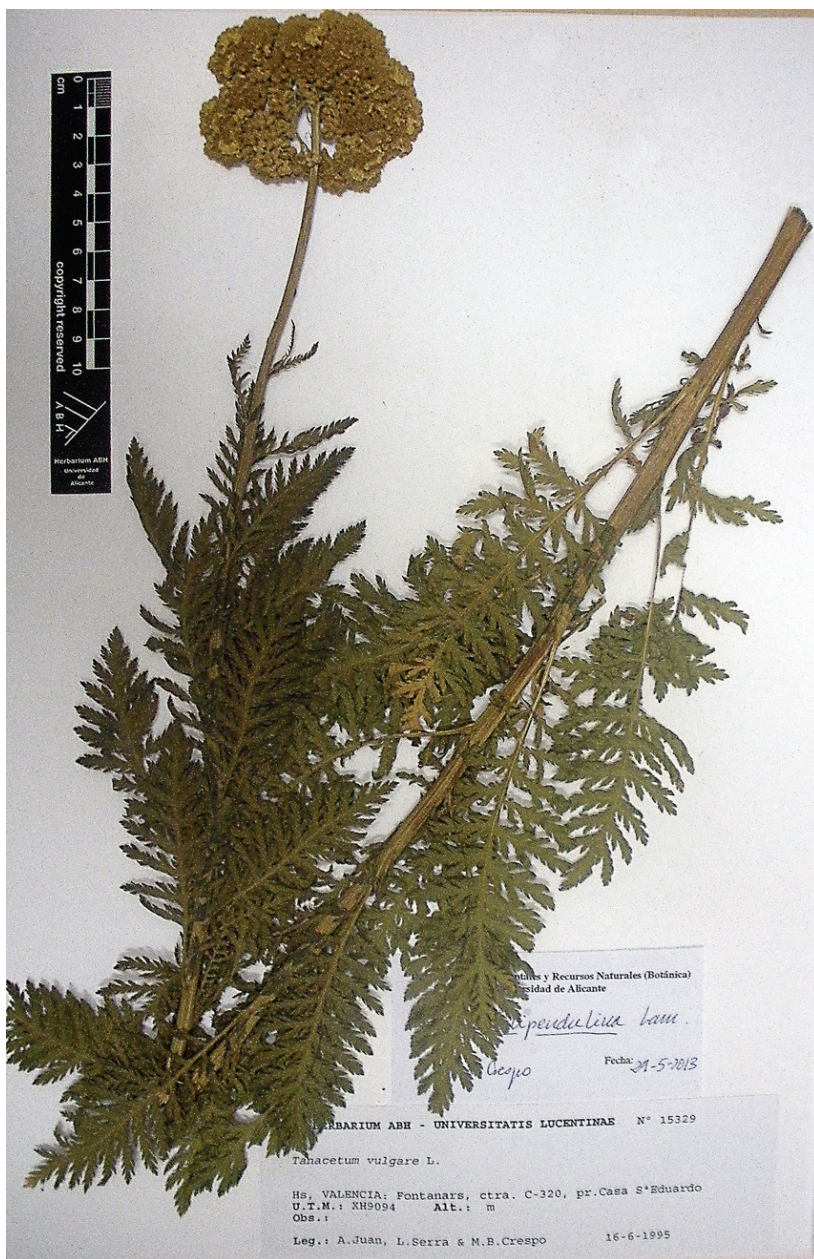
Fig. 1.- Achillea filipendulina , de Fontanars dels Alforins (ABH 15329).

RATH, 1975). Los materiales que aquí se aportan (Fig. 1) se habían confundido con Tanacetum vulgare L., especie con la que