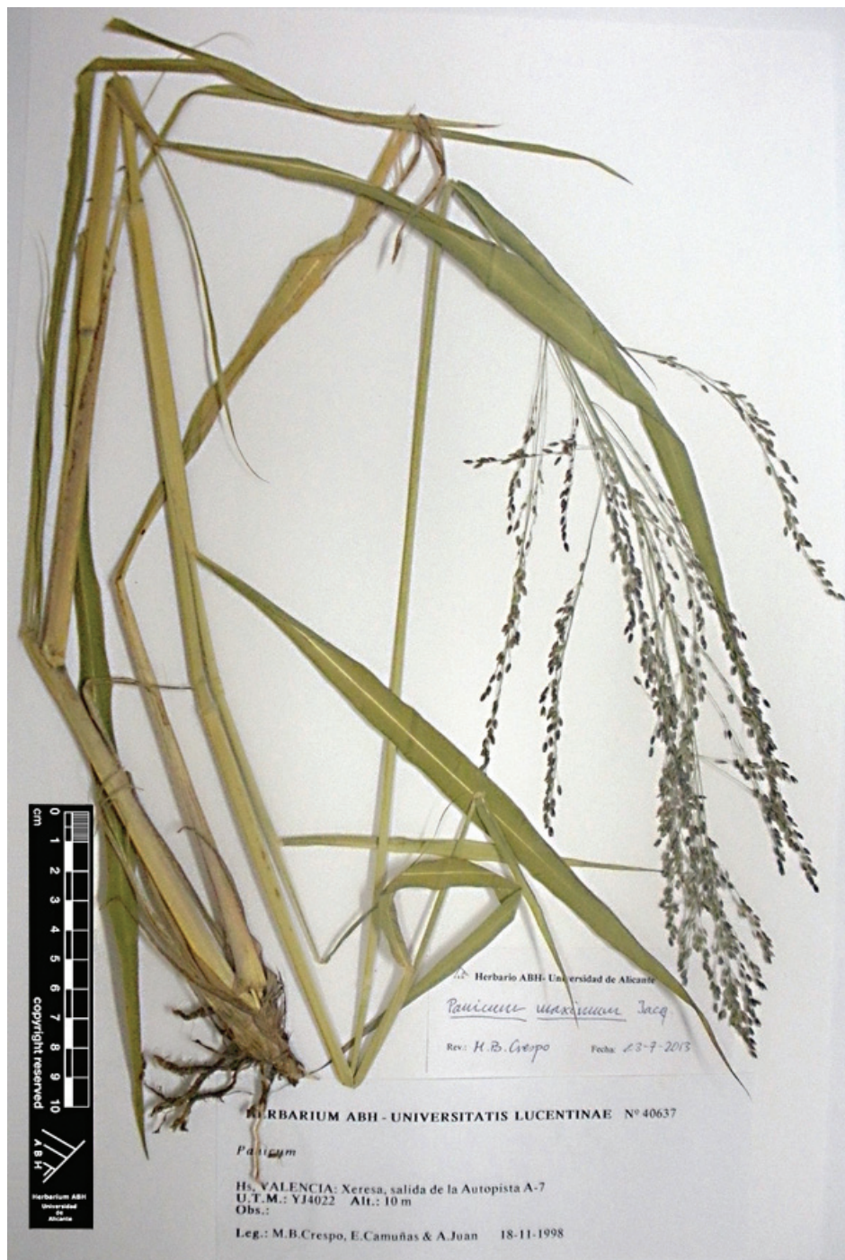
Fig. 6.- Panicum maximum Jacq., de Xeresa (ABH 40637).