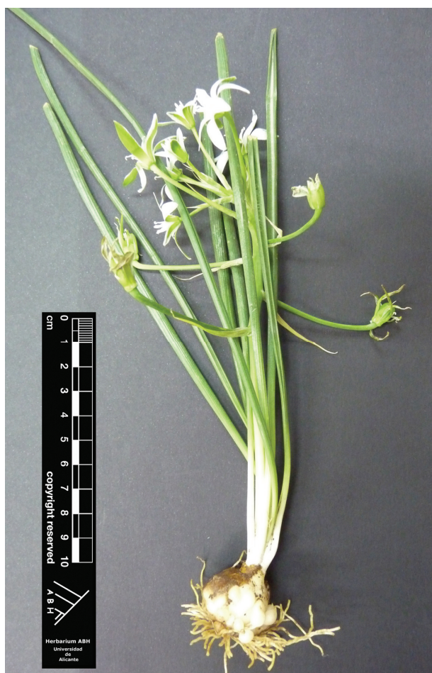
Fig. 4.— Ornithogalum divergens , de Alicante (ABH 69026).

Recientemente, VERLOOVE & SÁNCHEZ GULLÓN (2012) han dado a conocer su presencia en el Algarve (Portugal), como primera localidad concreta en la flora ibérica. Por ello, la que aquí presentamos parece ser su primera referencia