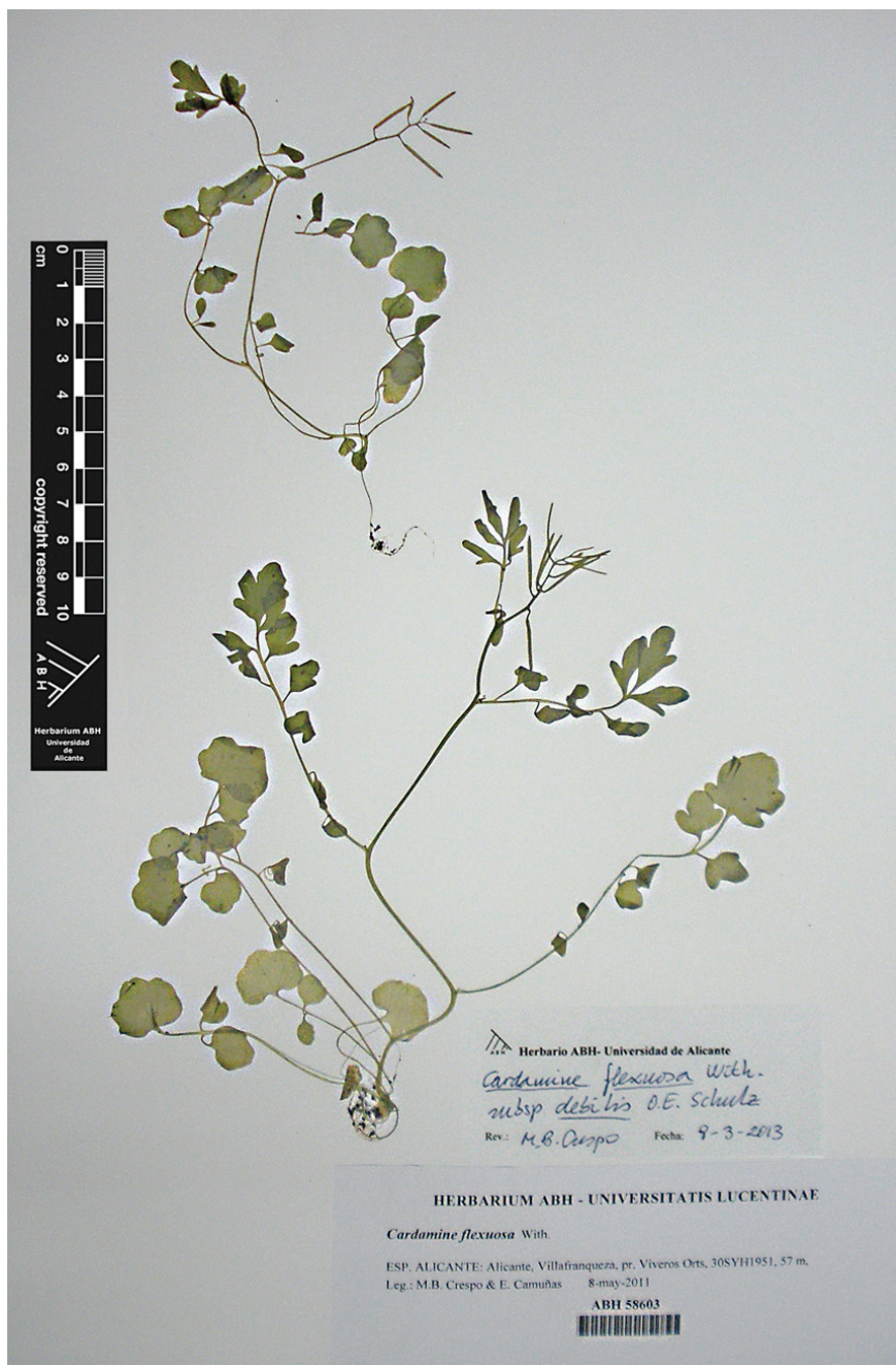
Fig. 2.- Cardamine flexuosa subsp. debilis O.E. Schulz, de Villafranqueza (ABH 58603).

trado en los últimos años en ambientes similares de Huelva y de las Islas Canarias (cf. VERLOOVE & SÁNCHEZ GULLÓN, 2012).