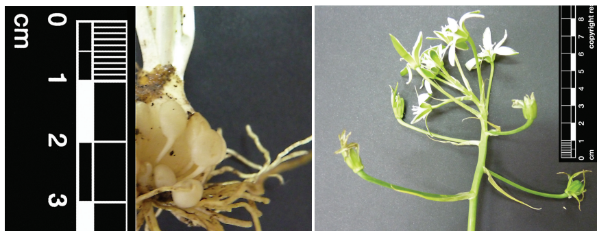
Fig. 5.– Detalle de los bulbillos basales (izquierda) e inflorescencia (derecha) de Ornithogalum divergens (ABH 69026).

Interesante novedad para la flora alicantina, pertenece al complejo taxonómico de O. umbellatum , especie centroeuropea con la que ha sido confundida. No obstante, O. divergens se diferencia fácilmente del resto de congéneres de dicho complejo, por la presencia en la base del bulbo de numerosos bulbillos de c. 5 mm de longitud, pediculados; inflorescencia ancha, con pedicelos florales inferiores