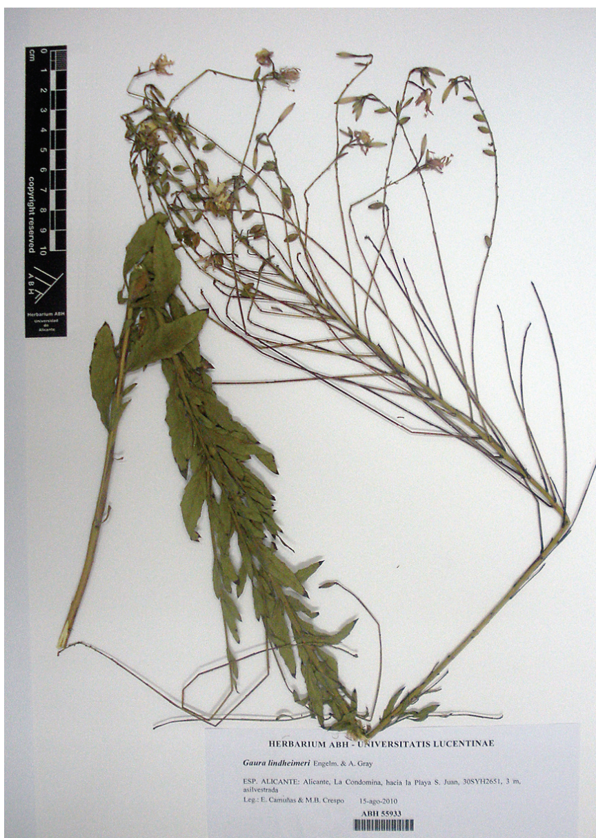
Fig. 3.– Gaura lindheimeri Engelm. & A. Gray, de Alicante (ABH 55933).

Especie nativa del sur de Estados Unidos (Louisiana y Texas) y norte de México, donde crece en áreas cálidas y bastante secas (RAVEN & GREGORY, 1972).