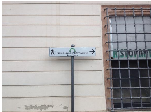
Imago 3: Ad institutum studiorum Varronianum

Hic tamen discrimen quo actio et actus secerni possunt nobis leue esse uidetur sic ut numquam, nec a fragmentis ullis corroborari potest Varronem opera diuersa confecisse alterum De actionibus scænicis , alterum De actis siue De actibus scænicis . Scrupulus tamen residet propter testimonium Hieronymi De actis scænicis , sed causam harum repetitionum iam dedimus easque a Suetonio eiusque ipsius fontibus tribuimus: Hieronymus enim fiduciam gerens sui præceptoris Suetonii, quam disceptationem de operibus hic enarraret raptim ac negligenter descripsit ac errores peperit aliquos. Magis idcirco adducimur ut unum fuisse opus Varronis atque idem credamus, cuius titulum De actionibus scænicis testimoniis grammaticis seruatis colligimus.