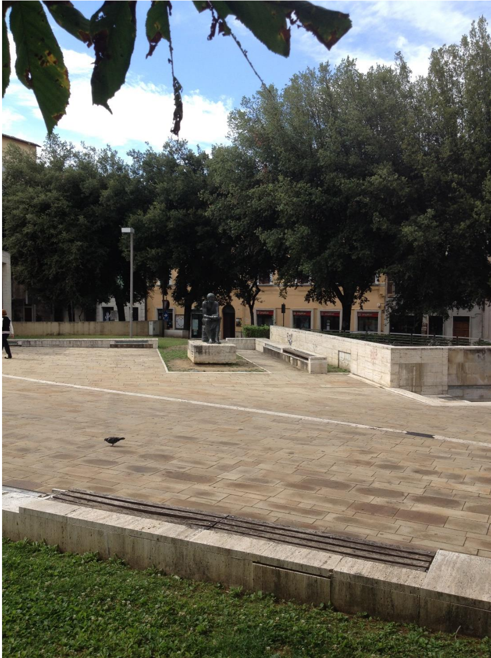
Imago 8: Signum Varronis in foro Oberdan

acies stili iis operibus seruaret in quibus uoluntas docendi partes haud primas obtinebat. In quibus inscriptionibus, si non tantum acuminis, at utilitatis plus.