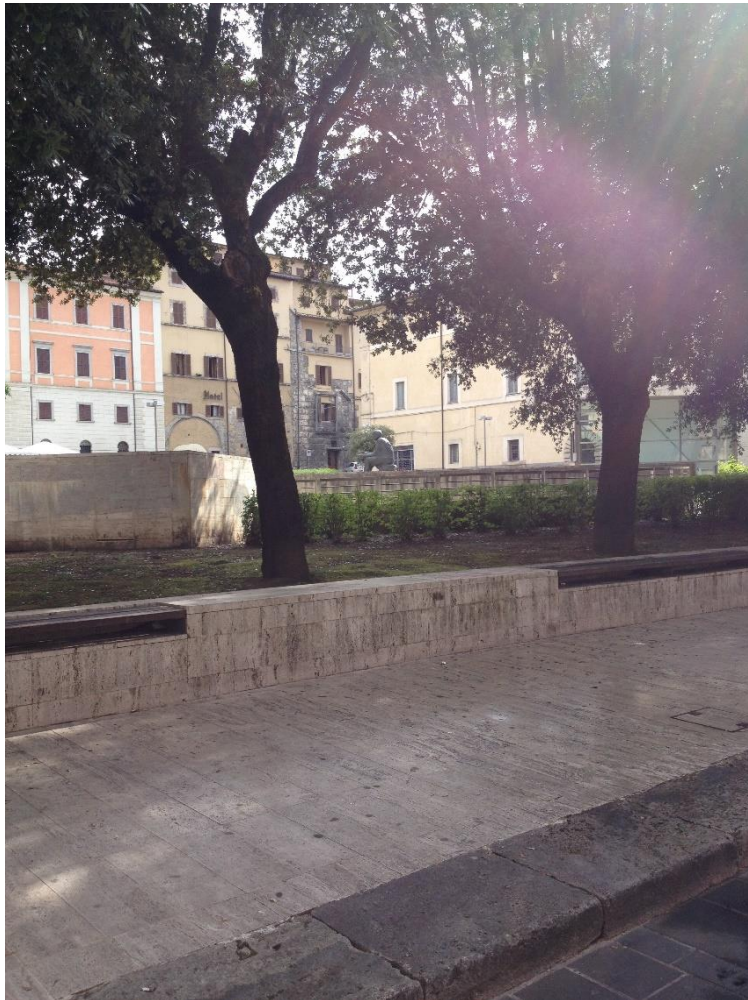
Imago 9: Forum Oberdan, Rieti

Itaque, ea modo certissima manent quæ ad inscriptionem Psuedotragædiæ pertinent, ubi indicia non desunt Varronis industriæ quam in operibus suis inscribendis adhibendam curavit: imitatio Græca, uerborum inuentio et compositionem; nouarum rerum cum antiquis callida temperatio et auctoris propositis accomodatio.