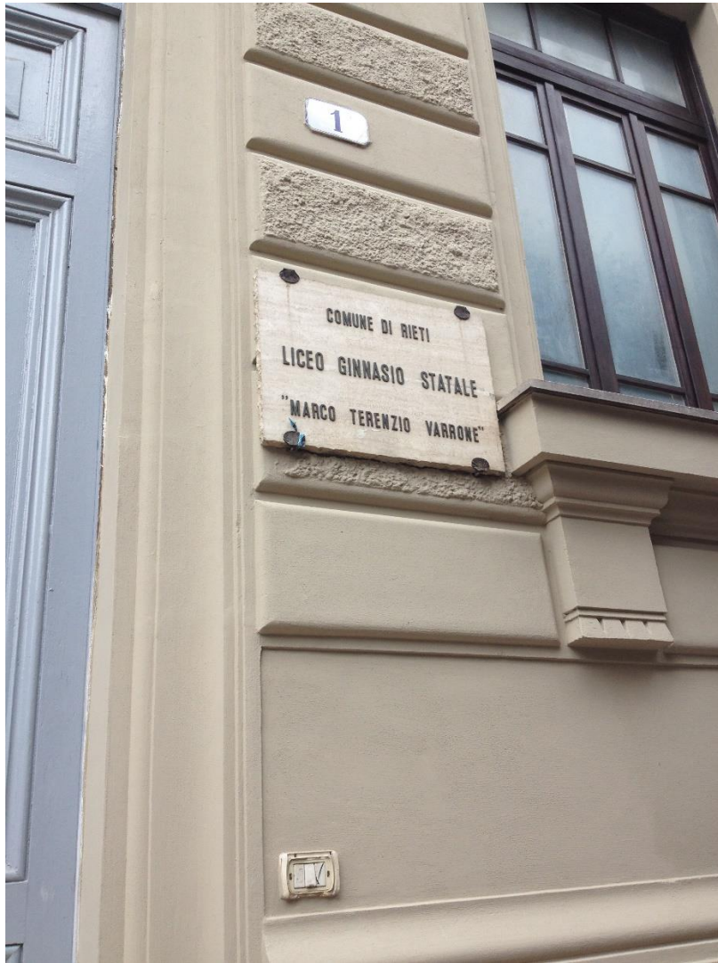
Imago 1: Lyceus Reatinus honori Varronis consecratus

bilidades de la lengua latina y empleado recursos genuinamente latinos. En definitiva, no hemos tratado de vestir de latín un discurso español, sino que hemos buscado la fuerza de las palabras latinas, no sólo su apariencia.