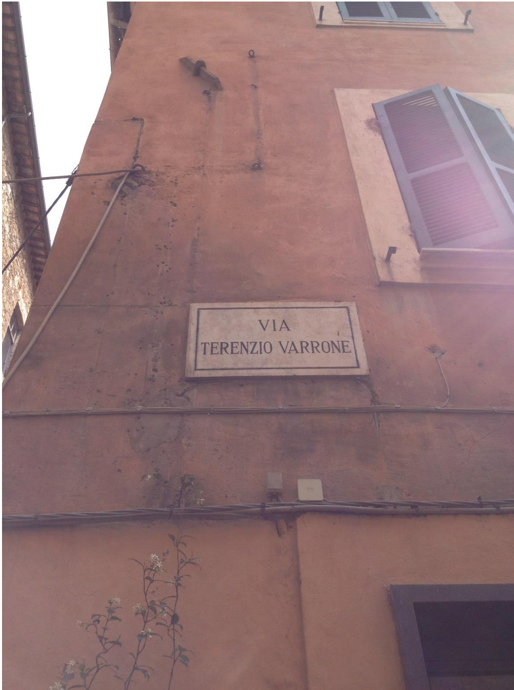
Imago 13: Via Reatina in memoriam Varronis

Sermo igitur Varronis auribus uulgi attemperatur: tot sunt proueria cum Græca tum Latina inter Menippearum titulos usurpata —uide etiam Cras credo, hodie nihil (§ 2.41.17), Est modus matulæ (§ 2.41.30), Mutuuum muli scabunt (§ 2.41.56), Nescis quid uesper serus uehat (§ 2.41.58).