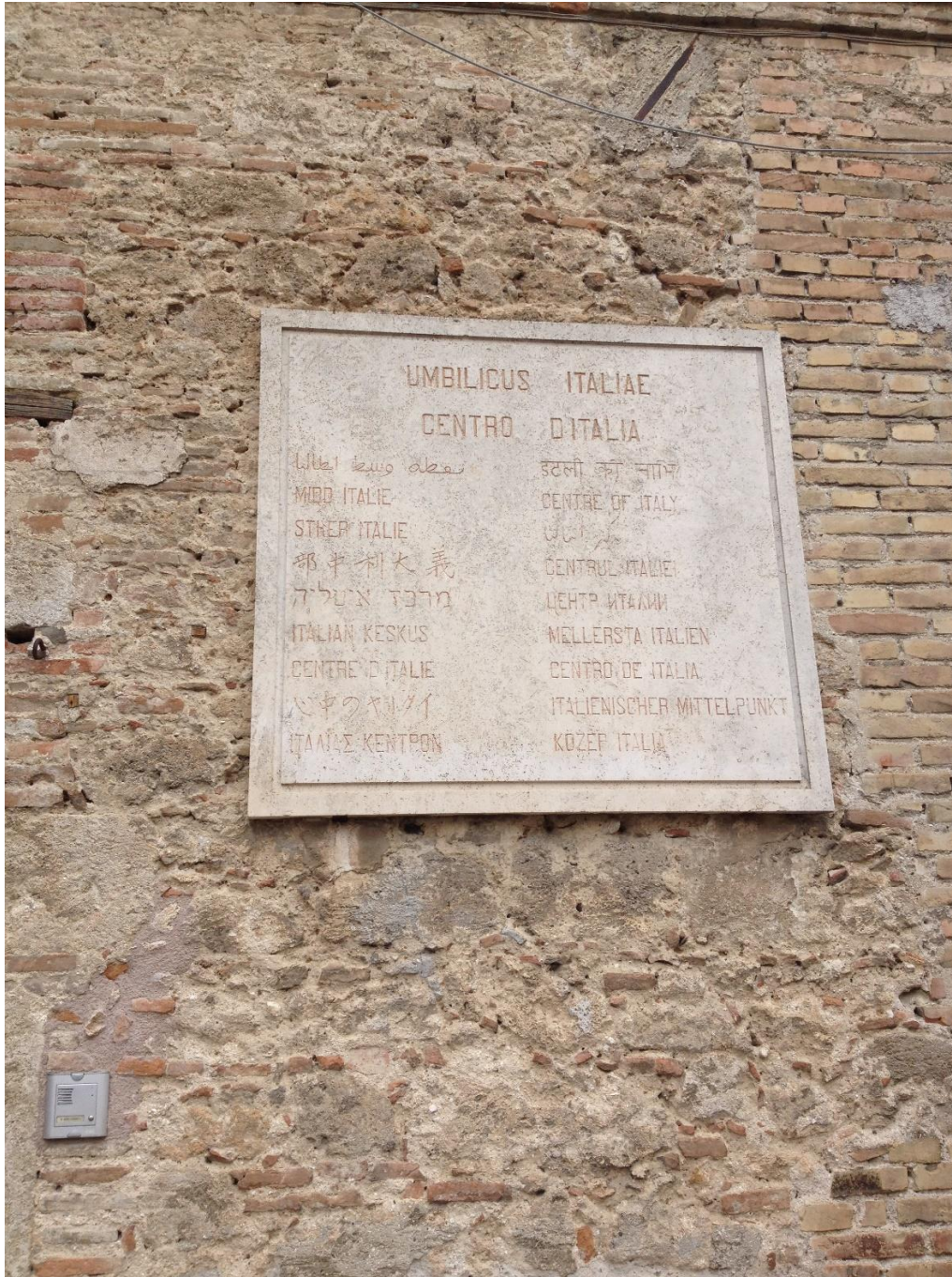
Imago 7: Rieti, umbilicus Italiae

cum dicat se neque Empedoclem, neque Democritum probare, exiguum nedum nullum dices.