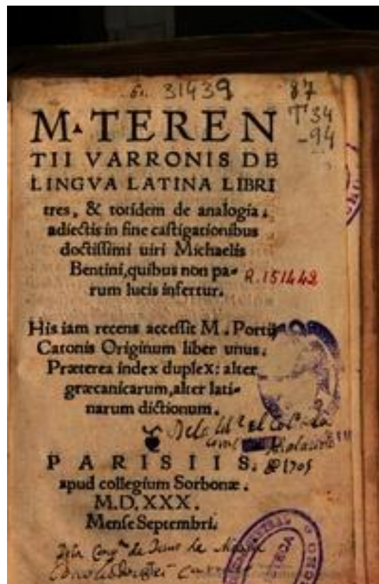
Imago 11: Editio uestus librorum Varronis De lingua Latina

Nomen igitur oppidi in inscriptionem inducitur ac sufficit ad uituperationem Varronis euocandam. At hoc quoque memoratu dignum, unum esse Baias in inscriptionibus Varronis nomen loci —uel topónimo —, quin etiam unum litterarum Latinarum huius usus exemplum.