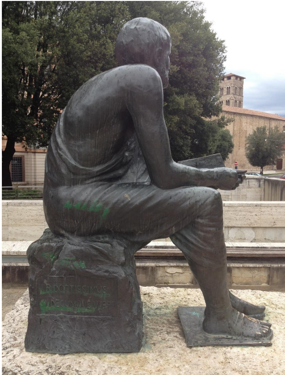
Imago 4: Signum Varronis in foro Oberdan, Rieti

ad utilitatem tum ad perspecuitatem rerum maximopere tendunt (TAYLOR 1977: 131), cui proposito et titulus, ut diximus, et figura dicendi Varronis opportune aptantur (VETTER 1958: 257).