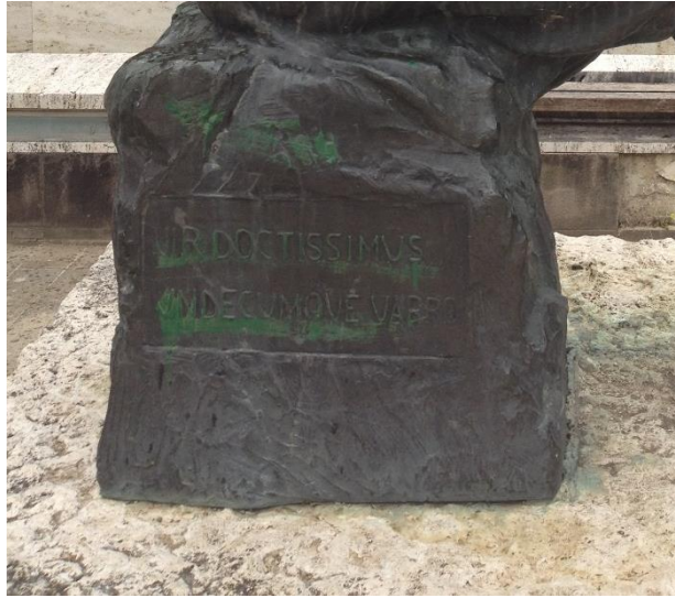
Imago 14 Inscriptio signi Varronis quæ uerba Terentiani Mauri memorant

Erat ergo Varroni in consiliis summum bonum attingere eamque notionem usu Græci sermonis, uerborum compositione, ornatu in uerbis nouatis atque inusitatis inlustrare. His adde adiectionem similium litterarum ac sonituum ex uocabulis eadem syllaba ineuntibus parata: τριοδίτης et τριπύλιος.