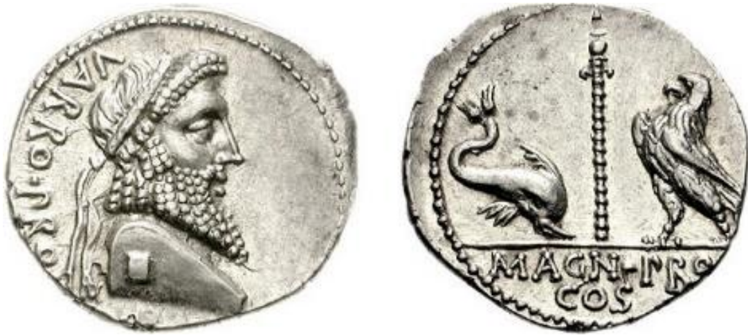
Imago 10: Nummus ætatis Varronis