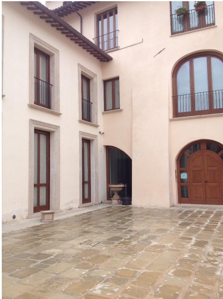
Imago 5: Institutio studiorum Varronis

nauales (Vegetius) nuncuparunt, quo opere libellus De æstuariis inscriptum quoque comprehenderetur. Tum demum, quamuis diuersæ sint horum operum nominationes, hoc non est infitiandum, exiguum esse locum prauis interpretationibus in argumento operum enodando, cum simul ac distinctæ, apertæ et dilucidæ illæ sint.