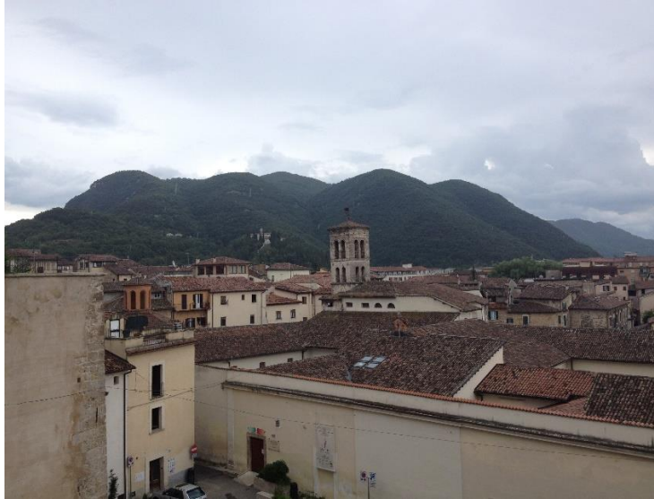
Imago 6: Conspectus oppidi Reatini

principia generandi illustret ac necessitates rei corroboret. Quæ mens et uoluntas magis uidentur in Græco αἰτίον concludi, ut in Ætiis ipse Varro uoluerat, Latine uero nisi per origines uix exprimi potest, ut in ipsius Varronis De originibus scænicis libris (§ 2.17) siue Catonis Origines (FERENCZY 1989: 353). Quod ad speciem tituli demum attinet, præualet ratio fixa ac solita per quam consueuit Varro propositum diulgandi et præcipiendi significare, scilicet de adiecto nomine uno uel altero.