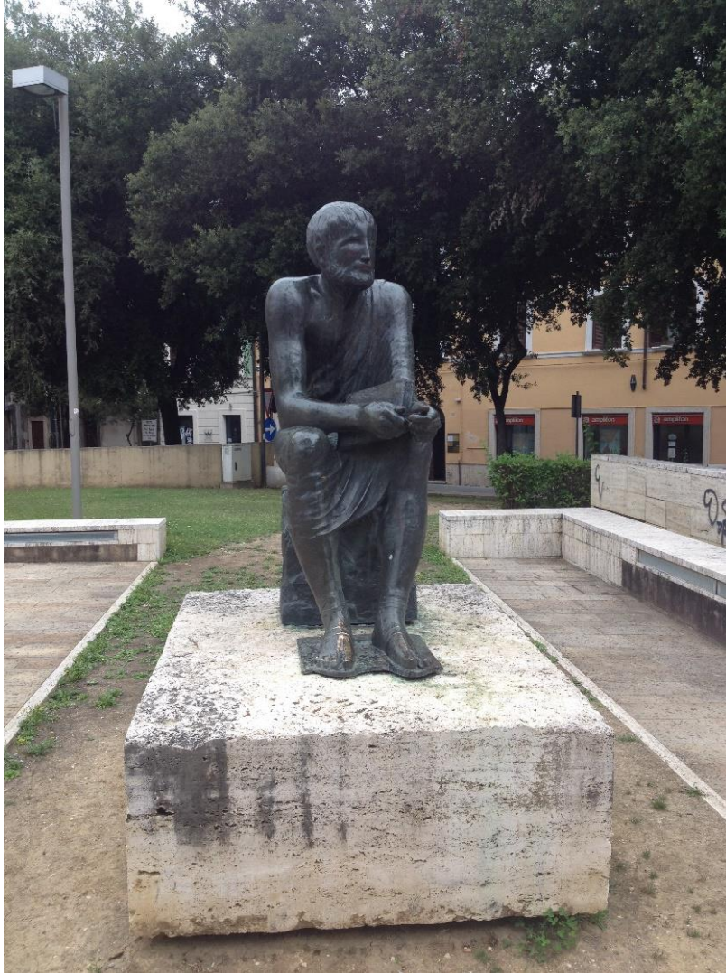
Imago 2: Signum Varronis in foro Oberdan, Rieti