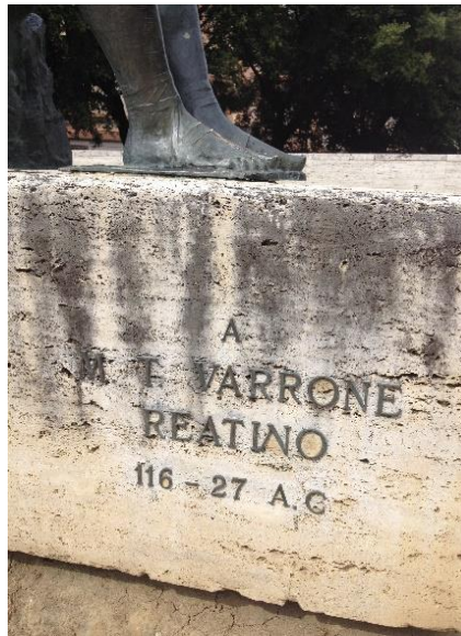
Imago 12: Signum Varronis in foro Oberdan

per eum euocat (RICCOMAGNO 1931: 42; MRAS 1914: 393). Ceterum, est hæc commutatio ac reimpositio nominum obscurum nihil nec ignotum, ita Varro peritus harum rerum fuit, quod in libris linguæ Latinæ demonstraui e doctrina (GUASPARRI 1998: 409–10), hic autem in saturis per exempla quæ peperit multa horum subsidiorum linguæ.