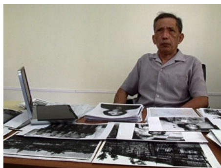
Imágenes 8-10: Kaing Guek Eav, alias Duch, entrevistado por Rithy Panh ( Duch, le maître des forges de l'enfer , Rithy Panh, 2011). Sobre el escritorio, entre otros documentos, imágenes de Bophana

Con todo, esta presencia no basta. La confrontación con el personaje resulta imprescindible, tanto más cuanto que Duch escribió con desprecio en su dossier la condición de vulgar prostituta de Bophana. Es necesario, pues, que el verdugo choque con la documentación de la víctima que él llevó a la enajenación mediante su pericia en la mecánica del interrogatorio. Duch dice haberlo olvidado, pero Panh desconfía de él y muestra, en cambio, su fe en la fuerza material de las fotografías y los documentos. Fuerza así el contacto y filma las manos de Duch deslizándose entre los restos materiales de esa vida segada. Una progresión va descubriéndose: del dossier de la víctima que reposa sobre el escritorio a las manos del verdugo que alzan