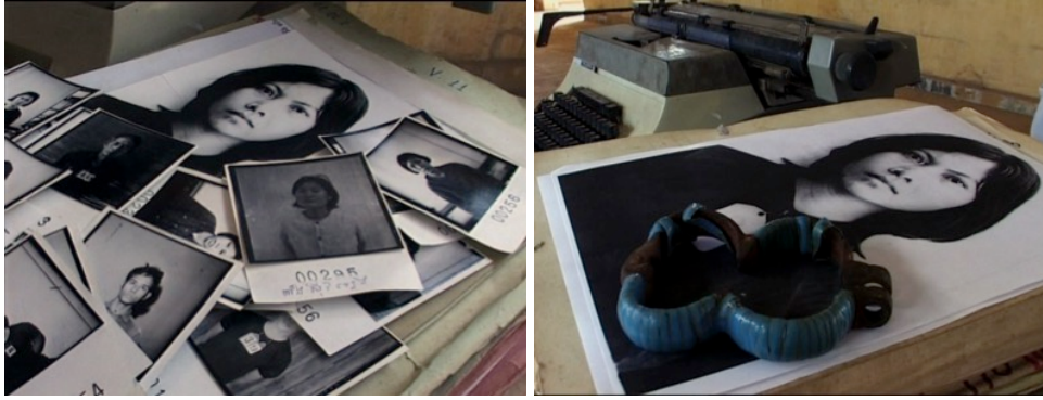
Imágenes 13-14: Mug shots desperdigados de víctimas de S-21, destacando el de Bophana; al lado, imagen-collage condensando el sufrimiento de Bophana (máquina de escribir como referencia a la confesión, mug shot ampliado, argollas que llevaba la muchacha en los pies durante su cautiverio). Ambos fotogramas de Duch, le maître des forges de l'enfer (Rithy Panh, 2011)