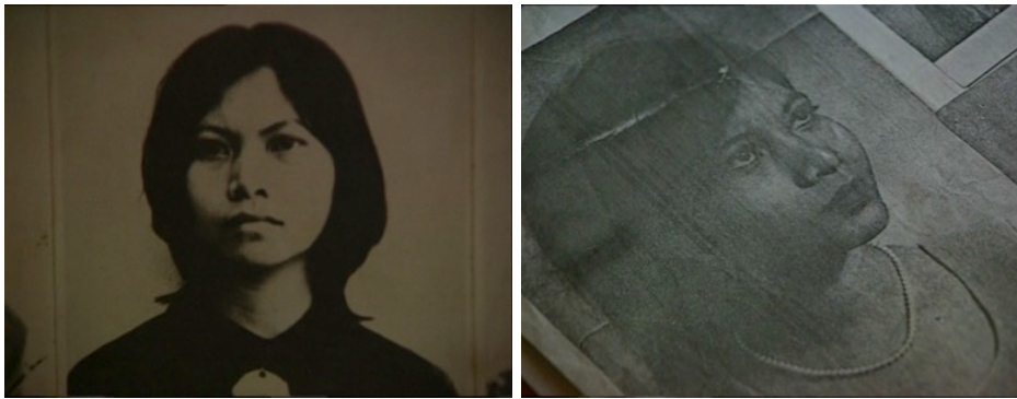
Imágenes 5-6: Dos fotogramas de Bophana, une tragédie cambodgienne (Rithy Panh, 1996)

estas imágenes convertidas ya en objetos matéricos, artefactos y no representaciones, invocando a la muchacha o, al menos, convocando sus vivencias, resucitándolas al calor de su propio recuerdo, insuflándole un hálito que las arranca del lugar donde fueron arrojadas las fichas de los enemigos del pueblo. Esa imagen de Bophana es lacerante, pues está extraída de los archivos mismos de su confesión, pero los ojos que la miran poseen otra calidad moral y humana. Como el pincel de Vann Nath, la cámara de Rithy Panh siente a Bophana escindida entre dos imágenes. Ninguna de ellas puede ser ignorada. El recorrido entre una y otra apela a la ética de la mirada. En el fondo, Panh, como a su manera Nath, le ofrecen sepultura y epitafio.