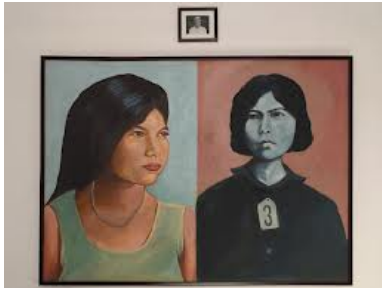
Imagen 15: Díptico completo de Bophana pintado por Vann Nath. Depositado en Bophana Audiovisual Center (Phnom Penh)

En la página web del Bophana Audiovisual Center de Phnom Penh, se resume la historia de la muchacha. 19 En la escalera que da acceso al segundo piso del edificio, se exhibe, discreto pero imponente, el díptico del pintor Vann Nath, fallecido en septiembre de 2011.