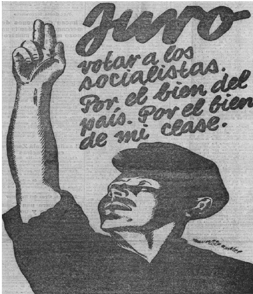
Imatge 2. Pel bé del país i la meua classe.

nació espanyola, com bé se sintetitza en el següent cartell electoral ofert per El Socialista l'1 de novembre,