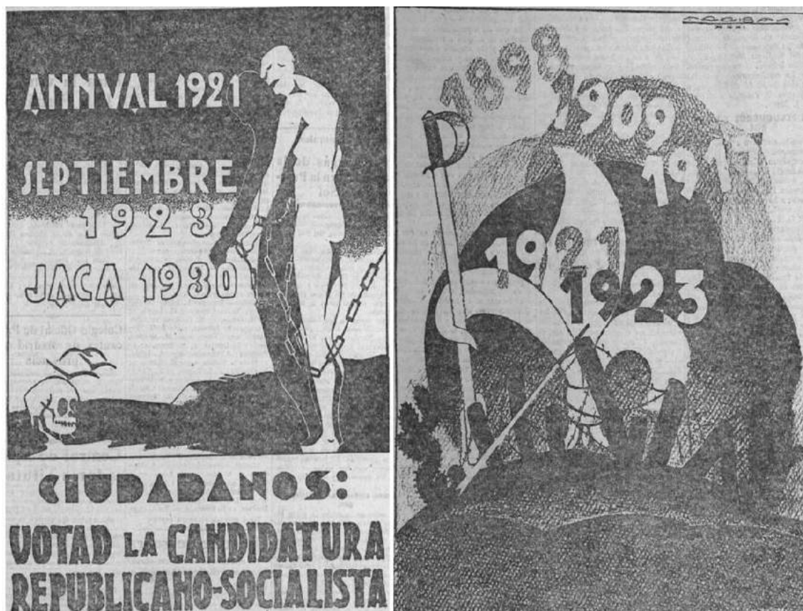
Imatge 1. Cartells electorals de les eleccions municipals d'abril de 1931.

Mitjançant cartells com aquests, reproduïts a El Socialista el 12 d'abril del 1931, els socialistes s'esforçaren en subratllar que la Monarquia havia perdut l'imperi colonial espanyol, havia emprés una guerra al Marroc contra la voluntat popular per a beneficiar els amos de les mines del Rif i havia imposat una dictadura repressiva. Com li resumia Prieto al monarca, Espanya era encara gran quan ell havia nascut, era una de les primeres potències del món. No obstant, davant la demanda d'autonomia cubana, l'obstinació monàrquica va provocar la pèrdua de tot l'imperi colonial i va acabar amb nostre poder. La malaptesa de la diplomàcia monàrquica hauria provocat, a més, que Espanya veiés segregada la ciutat de Tànger del protectorat espanyol, reduït a una franja territorial abrupta i improductiva que ens hauria costat rius de sang i milions de