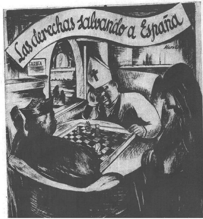
Imatge 3. Les dretes salvant Espanya.

Des de Claridad , a falta de tres dies per a les votacions, tres cartells electorals repetien la idea d'unes dretes alienes a la situació nacional, representants d'una Espanya clerical, fosca i morta, front a l'Espanya vital, la del treball i l'estudi 1722 .