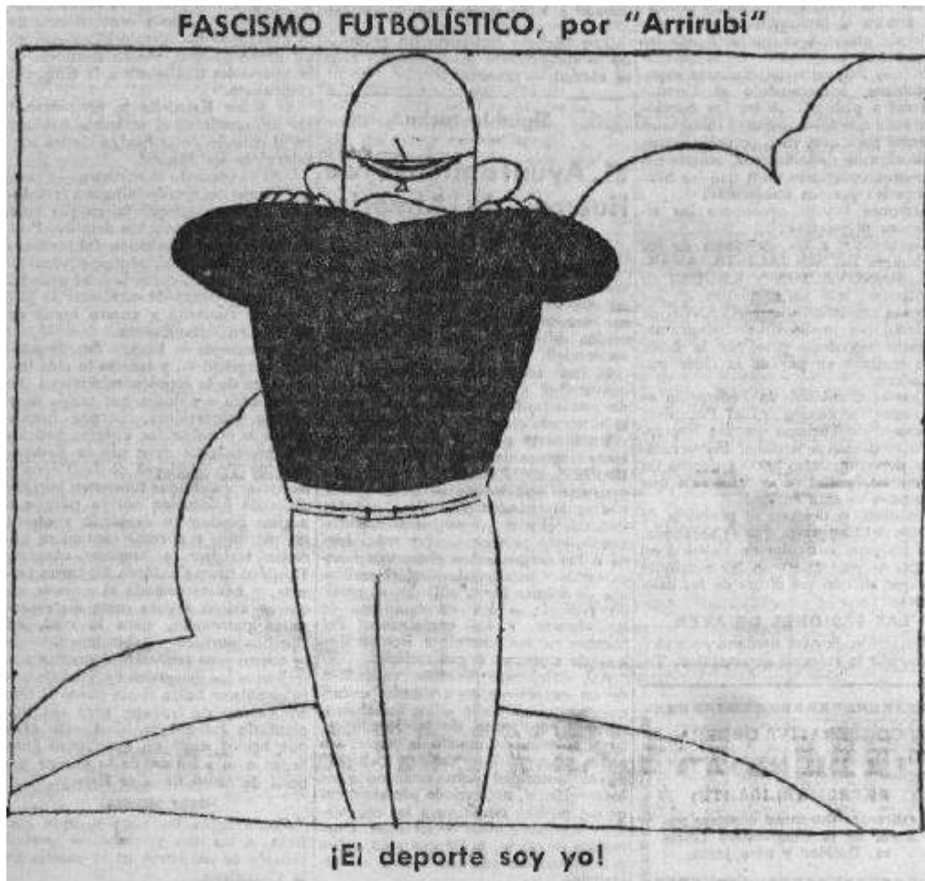
Imatge 1. L'esport sóc jo.

població i amagar les penúries de l'economia italiana. A canvi de la docilitat dels obrers italians, Mussolini els oferiria un campionat del món arreglat de bestreta amb el suborn dels àrbitres 1202 . Aquella acusació, inserida en les notícies internacionals, es va acompanyar al mateix número de 2 de juny de la següent vinyeta: