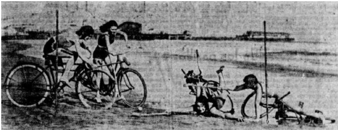
Imatge 2. Dones practicant esport.

Des de la gràcia femenina , es donava pas a altre tipus d'insinuacions. Sota la següent fotografia, inclosa sense cap tipus de motivació especial ni notícia concreta que l'acompanyés, la redacció es preguntava si es podia considerar les protagonistes ciclistes, jugadores de criquet o nedadores; no obstant, “ todo se les puede tolerar en honor a sus merecimientos deportivos y demás... ” 1268 . Els tres punts finals convidaven els lectors a identificar quins eren els altres mèrits de les quatre joves.