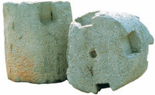
Grans contrapesos de premsa procedents de la vil·la de la Torrassa (Vila-real-Betxí).

Al País Valencià no es coneix el poblament rural més que de manera bastant superficial. Entre els estudis de conjunt basats en prospeccions i en la revisió d'excavacions anteriors destaquen els realitzats per Pingarrón entre els rius Palància i Magre, i per nosaltres mateixos a les comarques septentrionals del litoral valencià, encara que fins ara l'únic publicat ha estat el de Járrega sobre l'Alt Palància. Les vil·les excavades en extensió i per tant millor conegudes són igualment molt escasses. D'aquestes, algunes van ser excavades en els segles XVIII (el Vilar al Puig; els Banyes de la Reina a Calp) o XIX (Algorós a Elx). Unes altres són només conegudes per algun monument (l'Arc de Cabanes; la Torre de Sant Josep de la Vila Joiosa), o principalment per destacades troballes sumptuàries