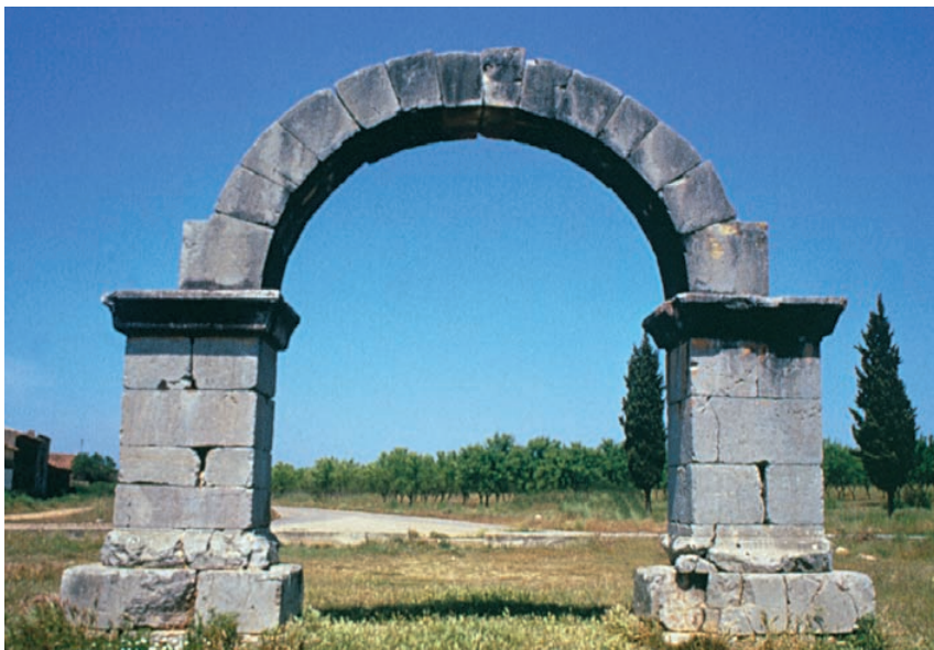
L'Arc de Cabanes (Castelló). Segle II. [Fot. Arxiu SIP].

Els programes decoratius de les vil·les comprenen fonamentalment escultures i paviments mosaics, a més de la pintura mural, els estucs i els revestiments de marbre. Entre les primeres es troben escultures de jardí com les hermes de Bacus del Mas de Víctor (Rossell), el Cabeçolet (Sagunt) i Fondos (Torís), i l' oscillum de Can Porcar (Llíria). Retrats imperials com el d'Adrià del Palmar (Borriol). Entre l'escultura ideal hi ha representacions de Bacus com les de l'Ereta dels Moros (Aldaia) i del Trull dels Moros (Sagunt); d'Afrodita com la de València la Vella (Riba-roja de Túria); de Nimfes