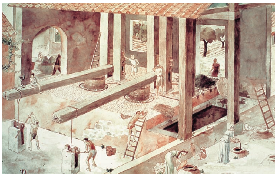
Recreació artística de la doble premsa trobada en l'almàssera (torcularium) de la vil·la romana del Parc de les Nacions (Alacant). [Dibuix P. Rosser-J. Sáez].

com algunes escultures (l'Ereta dels Moros a Aldaia) o mosaics (el Poaig de Montcada). Finalment, algunes han estat parcialment excavades, però els resultats de la investigació no han estat donats a conèixer més que de manera resumida (Benicató de Nules; el Circuit de Xest; el Parc de les Nacions d'Alacant; la Canyada Joana de Crevillent).