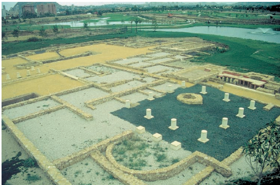
Vista de la vil·la romana de Casa Ferrer I, prop de Lucentum. Segles I-III.