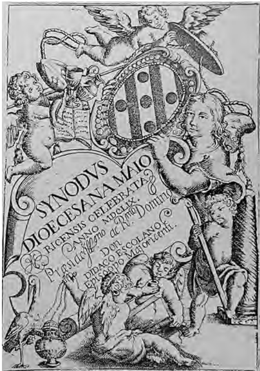
Fig. 3. Gravata anònima, 1660.

descartable com el gravat del sínode diocesà de 1659, editat el 1660, o un mapa per il·lustrar un llibre de l'historiador Vicenç Mut. 20