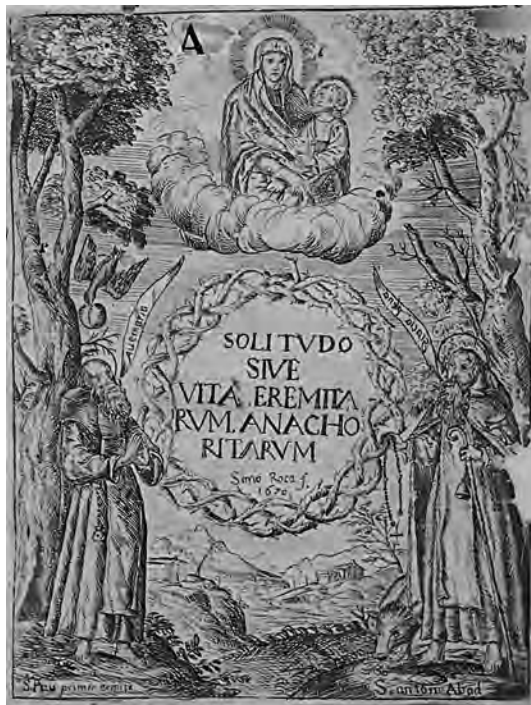
Fig. 2. Gravats de Simó Roca, 1670. Biblioteca Lluís Alemany, Ciutat de Mallorca.

sant Pau ermità. Els dos sants anacoretas per excel·lència i amb molta tradició a l'illa mallorquina. El centre de l'obra és on hi apareix el títol del llibre i la firma de l'autor envoltat tot per un cercle d'espines semblant a la corona de Crist (fig. 2).