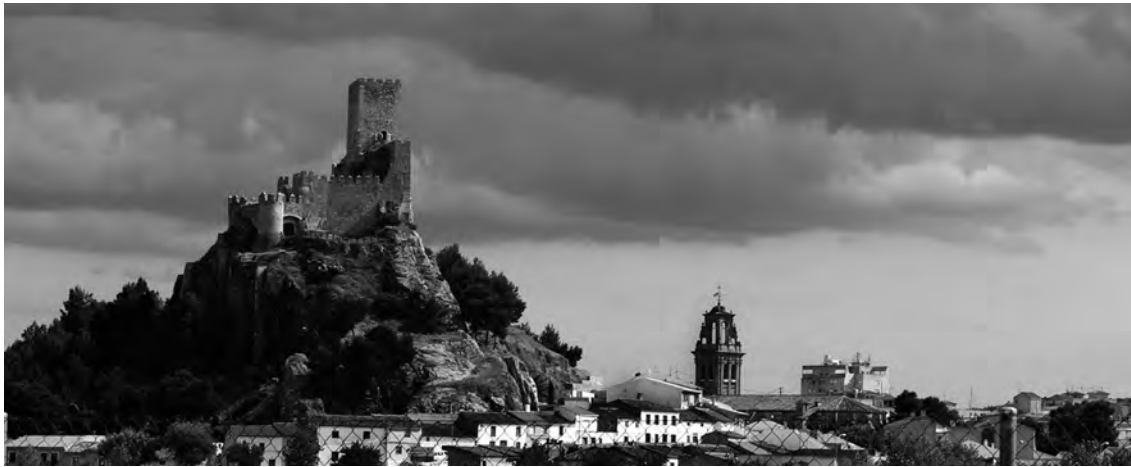
Fig. 1. Vista general de la torre del homenaje del Castillo de Almansa.

denó construir, Don Juan Pacheco, tampoco era un noble cualquiera del siglo XV castellano. 2 De hecho, ninguno de los castillos que mandó levantar durante el tercer cuarto del siglo XV es un castillo defensivo al uso, simplemente relacionados con cuestiones funcionales y castrenses. Son mucho más. Son auténticos mensajes simbólicos tanto para sus súbditos directos, para sus iguales en la corte de Castilla (si es que los había) y para el propio monarca Enrique IV, con el cual Pacheco rivalizaba en importancia y poder. 3 Juan Fernández Pacheco y Téllez Girón nació en 1419 en la villa conquense de Belmonte, y hasta su muerte en 1474 cerca de Trujillo, Cáceres, su vida estuvo íntimamente ligada al destino del Reino de Castilla, al de los monarcas con los que convivió y al de los nobles con los que compitió por el favor real. Hijo de Alonso Téllez Girón, modesto señor de Belmonte, y de María Pacheco, noble descendiente de antiguos e importantes aristócratas portugueses exiliados tras la guerra de 1397, la trayectoria de Juan Pacheco siempre estuvo relacionada con la de su hermano Pedro Girón. Ambos se criaron como pajes en la casa del Condestable de Castilla don Álvaro de Luna, de quién aprendieron los secretos y argucias para moverse en aguas tan procelosas como las de la Castilla de mediados del si-