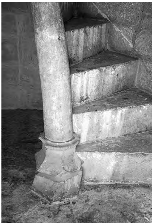
Fig. 5. Detalle del arranque de la escalera del Castillo de Almansa.