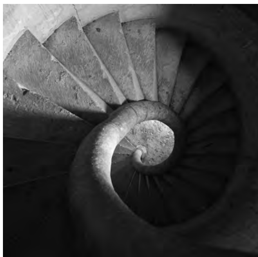
Fig. 4. Escalera de caracol "de Mallorca" u "ojo abierto" del Castillo de Almansa.

Para poder contextualizar mejor la tremenda importancia de la escalera de Almansa hay que comenzar analizando el papel que este tipo de caracoles tuvieron en la práctica arquitectónica de finales de la Edad Media. Las escaleras "de Mallorca" adquirieron el valor de auténticos iconos o arquetipos de la mejor arquitectura hispana en piedra, suponiendo para aquellos que eran capaces de resolverlas una prueba irrefutable de su maestría y la mejor de las cartas de presentación para obtener trabajos de mayor enjundia en el futuro. Así queda de manifiesto en dos de los textos más importantes de la tratadística arquitectónica española del arte de construir en piedra como son el " Libro de trazas de cortes de piedra " de Alonso de Vandelvira (1580), y " Cerramientos y trazas de montea " de Ginés Martínez de Aranda (1600). 28 A diferencia de la escalera de caracol de husillo, la escalera de "ojo abierto" es exclusiva de la arquitectura medieval tardía, y según Perouse de Montclos (1985), no hay noticias de ejemplo alguno de esta tipología de caracoles anteriores al siglo XV. 29