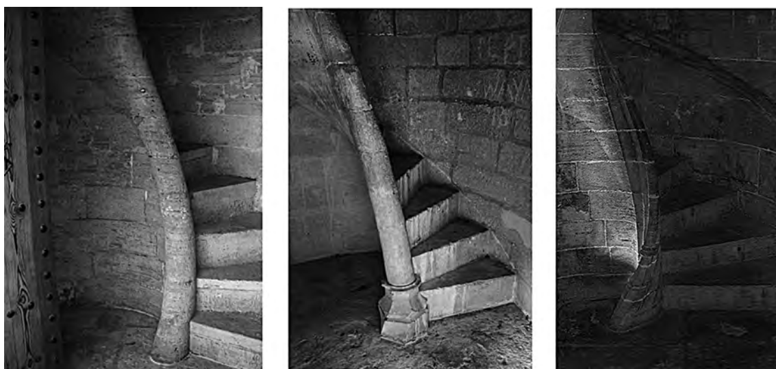
Fig. 6. Comparación entre escaleras. De izquierda a derecha: Portal de Quart de Francesc Baldomar; Castillo de Almansa; Lonja de Valencia de Pere Compte.