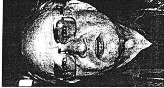
Edgar Morin y Pierre Mauroy.

La objetividad, que, en palabras de Vidal-Beneyto, "no puede ser ni una invocación mágica ni una coartada para cualquier práctica, sino el control objetivado de la propia subjetividad", exige, según la opinión unánime de los partici-