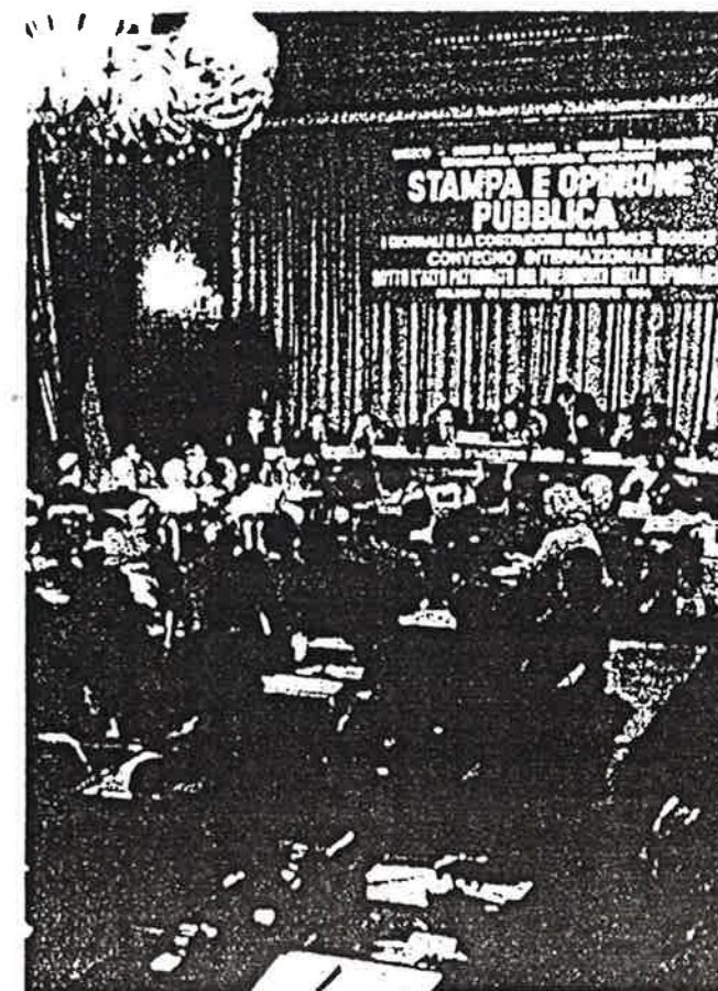
La sala del Consiglio comunale, ove è iniziato il convegno internazionale su «Stampa e opinione pubblica».