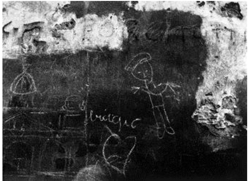
Nino Migliori, Muro

De esta forma, el fotógrafo boloñés se acerca con el paso de los años cada vez más al arte conceptual, desarrollado en los años sesenta, y a una estrategia en la que la imagen fotográfica juega con su condición potencial de grabación casual de una acción artística, de la que, sin embargo, está destinada a ser el producto final. Este acercamiento supone un acto de creación artística que comienza mucho antes de que la máquina esté preparada para disparar, ya que comienza con el diseño de la idea, con el pensamiento visual.