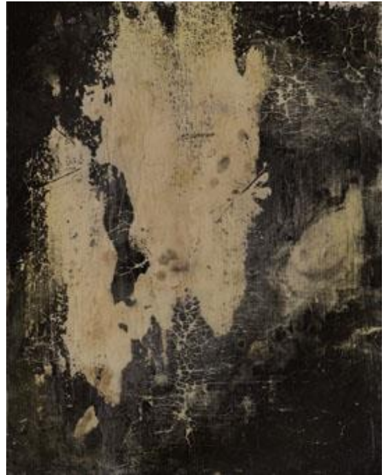
Nino Migliori, Ossidazione

Por último, cabe mencionar una de sus obras más recientes es muy importante para comprender la poética del artista: se trata del conjunto de imágenes fotográficas realizadas en el cementerio de los niños de la Cartuja de Bolonia. El fotógrafo apunta que las tumbas de los niños están llenas regularmente de juguetes y muñecos, testigos de la relación cotidiana que los padres siguen manteniendo con sus pequeños difuntos. Esta ritualidad permite una posible reflexión sobre la propia naturaleza de la imagen y sus significados simbólicos. Escribe a propósito de esto el psicoanalista Serge Tisseron: