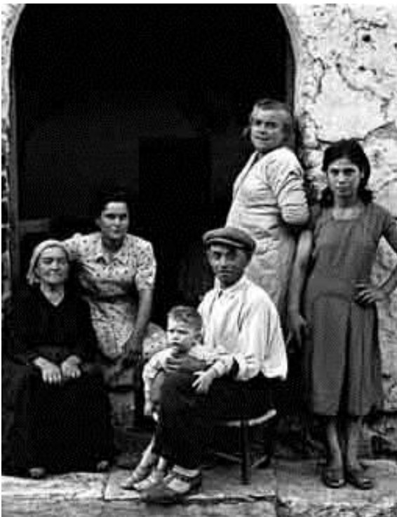
Nino Migliori, Gente del Sud

Reconstruyendo desde el principio la compleja carrera de este artista es posible situar sus inicios al final de los años cuarenta, al final de la guerra, en una Bolonia maltratada por las operaciones bélicas. En este período, Migliori intenta, por una parte, volver a adueñarse de su ciudad documentando los espacios cotidianos en los que le toca vivir y trabajando, al mismo tiempo, en imágenes obtenidas sin utilizar la máquina de fotos y en imágenes realizadas con un estilo que podríamos aproximar al neorrealismo fotográfico 1 .