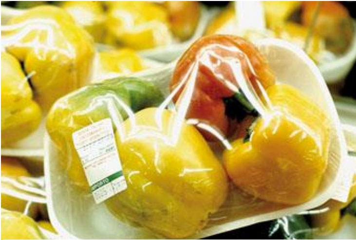
Nino Migliori, Natura morta

El fotógrafo boloñés se dirige hacia lo informal movido por la exigencia de probar una alteración de la trama de lectura, de la estructura asimilada. La fotografía es un encuentro entre la imagen y lo que está metabolizado en ella.