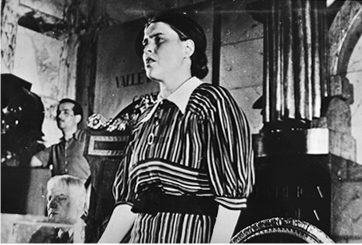
Fig. 1. Fotografía de Anna Seghers durante su intervención en el Segundo Congreso de Escritores Antifascistas para la Defensa de la Cultura. Valencia, 5 de julio de 1937.