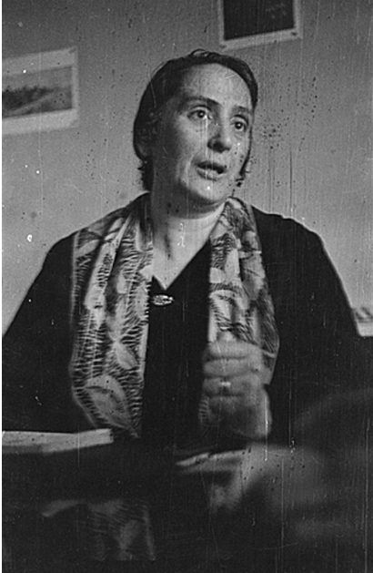
Fig. 18. Dolores Ibárruri La Pasionaria retratada por Gerda Taro. Valencia, primavera de 1937 © ICP.