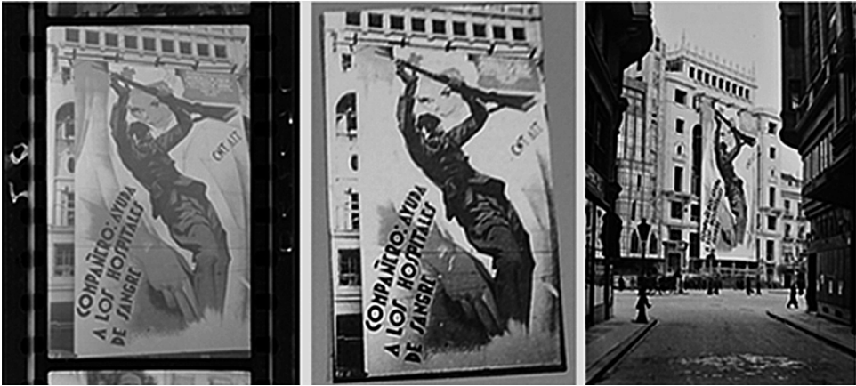
Figs. 9, 10 y 11. Negativo redescubierto en México en 2007, copia por contacto nº 23 del cuaderno nº 7 (ANP) y copia de negativo original en la sede del Archivo Histórico del Partido Comunista Español. De la serie de Gerda Taro sobre Valencia, marzo-mayo de 1937.