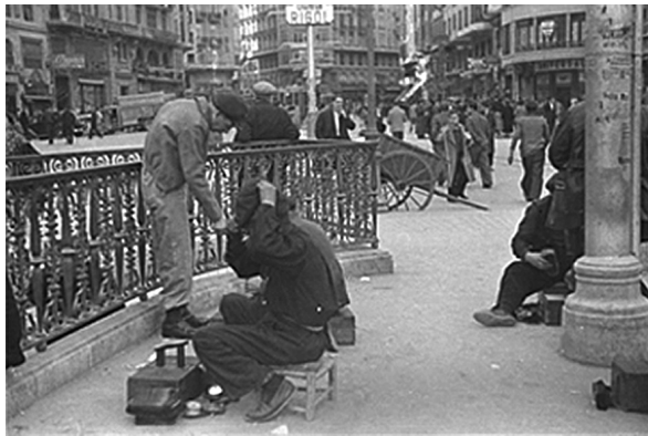
Figs. 2 y 3. La vida en el centro de Valencia durante la primavera de 1937.