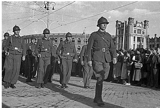
Fig. 16. Oficiales al paso de la Plaza de Toros y la Estación del Norte de Valencia durante el multitudinario cortejo fúnebre del general Pavol Lukács. Valencia, 12 de junio de 1937. Fotografía de Gerda Taro © ICP. Copia índice en el Cuaderno n° 1, contacto n° 78 (ANP).