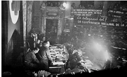
Fig. 15. Vista del sistema de iluminación de la tribuna presidencial del Salón de Actos del Ayuntamiento de Valencia (en Nothomb, 2001: 139).