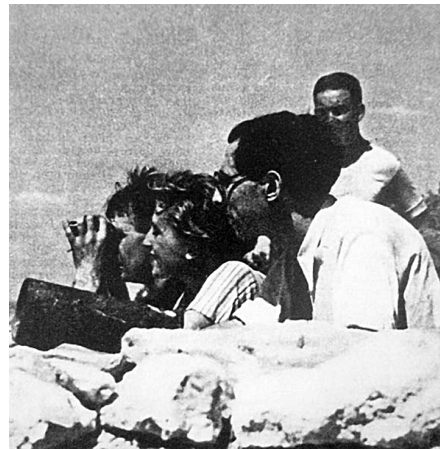
Fig. 19. Gerda Taro fotografiada junto a los intelectuales en Madrid durante el mes de julio de 1937. Días después la fotoperiodista perdía la vida en calidad de corresponsal gráfica del periódico francés Ce Soir © ICP.

textuales que la fotografía propone, y para concluir con el apartado que cierra este último bloque, podemos añadir que la imagen remite a los retratos realizados por Taro en Valencia a Dolores Ibárruri, alias La Pasionaria , la más carismática propagandista de los republicanos durante la Guerra Civil (Fig. 18). También se reconoce la clara influencia de Robert Capa a partir de los retratos que el fotógrafo realizó a Leon Trotsky durante su conferencia en la Universidad de Copenhague el 27 de noviembre de 1932.