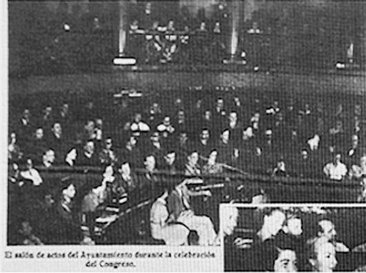
Fig. 7. Gerda Taro, vestida con falda y blusa blanca, aparece sentada en la primera fila del palco durante la inauguración del Segundo Congreso de Intelectuales Antifascistas. Revista Crónica , 18 de julio de 1937.