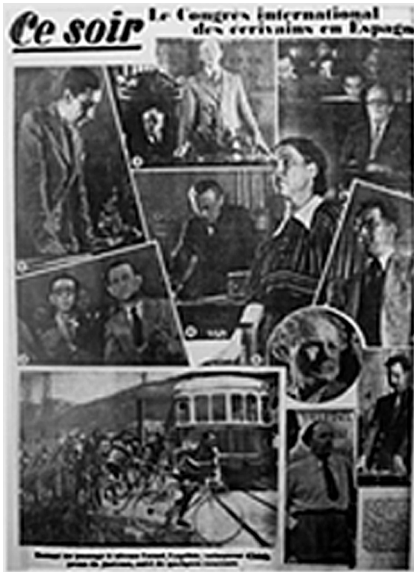
Fig. 5. Ce Soir , 11 de julio de 1937, última página.