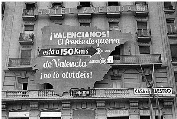
Fig. 4. Plaza de Emilio Castelar (actualmente del Ayuntamiento). Valencia, marzo-mayo 1937.