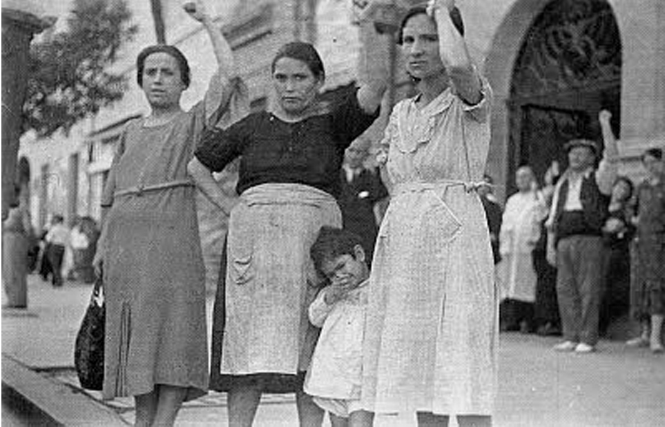
Fig. 17. Mujeres durante el cortejo fúnebre del general Lukács. Valencia, 12 de junio de 1937. Copia índice en el cuaderno nº 1, contacto nº 246 (ANP).

Ciertamente, en este plano los Estados Unidos y algunos países de Europa aventajaban en gran medida a la situación española 11 . Sin embargo, estas libertades recientemente adquiridas también se encontraron amenazadas por la depresión económica del 29, suceso que afectó limitando la continuidad del desarrollo profesional femenino iniciado durante la Primera Guerra Mundial (Nash y Tavera, 2003: 206). En el plano europeo, las recientes reformas que habían beneficiado al colectivo mermaron a consecuencia de la penetración de las ideologías fascistas y comunistas que, aunque rivales como doctrinas, coincidían en la medida de imponer el regreso de la mujer a sus funciones tradicionales 12 . Esta incertidumbre ante una regresión inminente para la mujer fue el tema a considerar por varias intelectuales antifascistas europeas, como la alemana Erika Mann, que planteaba a sus lectores “si debe escribir la mujer, escribir libros sin más, cuando cree que puede hacerlo”