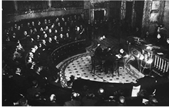
Fig. 14. Vista del sistema de iluminación general del Salón de Actos del Ayuntamiento de Valencia. Revista Crónica , 18 de julio de 1937.