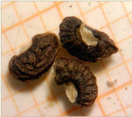
Fig. 1: Núculas maduras de Nonea echioides (de color muy oscuro, reniformes y netamente curvadas en la base, con anillo basal muy estrecho y no contraído). Fotografías de J.A. Arizaleta, realizadas a mano alzada con teléfono móvil más un objetivo macro.