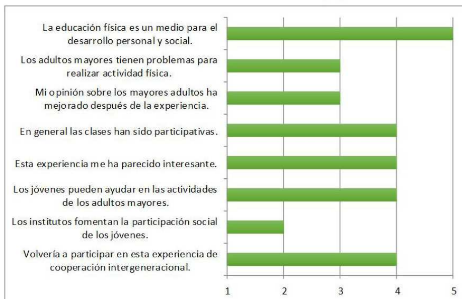
Tabla 5. Resultados cuestionario alumnado sobre desarrollo del programa

De los resultados obtenidos mediante los cuestionarios de los alumnos/as cabe destacar que la opinión de los jóvenes sobre los adultos mayores no ha mejorado tanto como se esperaba. Por otro lado, piensan que los institutos podrían fomentar mucho más la participación social de los jóvenes y que los jóvenes son útiles para la ayuda en las actividades de los adultos mayores. En general, la mayoría volvería a participar en una experiencia intergeneracional.