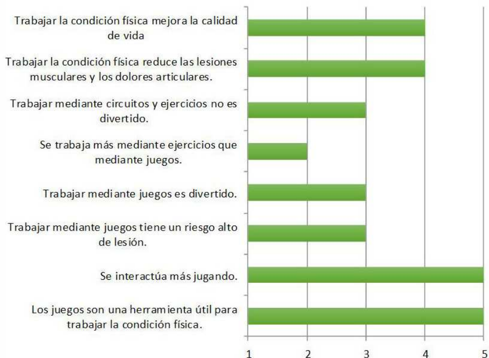
Tabla 4. Importancia condición física y salud según alumnado

Las respuestas indican que la mayoría de los alumnos/as valoró de manera positiva la utilidad de los juegos motores como herramienta básica en las actividades de acondicionamiento físico para mujeres de edad adulta. Principalmente, porque se fomentan las relaciones sociales entre el grupo, y esto es algo que después de la experiencia de los alumnos/as con la actividad han considerado que es el motor de la misma.