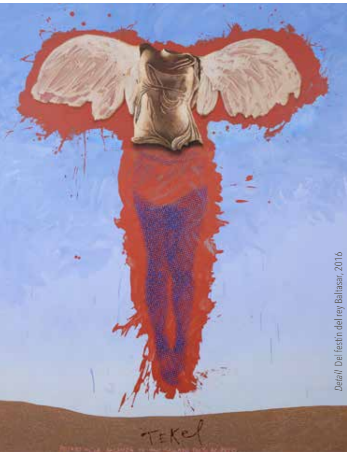
Detall Del festí del rey Baltasar, 2016

La seua obra ha sigut exposada en nombroses ciutats: Madrid, Sevilla, Saragossa, Barcelona, Santander, Palma de Mallorca, així com també a París, Mèxic D. F., Munic, Buenos Aires i Belgrad. Destaquen les exposicions que, sota el títol de Bandera, bandera , va mostrar a la Fundació Joan Miró de Barcelona en 1980 o l'antològica, juntament amb Armengol i Boix, que en 1995 va exhibir l'IVAM de València. En 2005 va exposar a la Galerie St. Laurent de París i al Centre d'Art Contemporani à cent mètres du centre du monde de Perpinyà en 2008. D'aquesta col·lecció s'ha fet una mostra antològica a la Fundació Chirivella-Soriano, de València, durant 2013 que, juntament amb Despulses , exhibida a la Fundació Caixa l'any 2000, constitueixen les més amples retrospectives. No ficció és la darrera de les seues propostes plàstiques que incideix en la construcció i la formulació de les iconografies actuals, que exploten el poder revelador i manipulador que qualsevol llenguatge porta incorporat en convocar el món de les sensacions i emocions. Juntament amb un conjunt de treballs de gran format que componen un fresc èpic sobre moments i fets històrics, l'artista continua experimentant amb nous formats expressius híbrids i donant protagonisme al contingut poètic de la música i la paraula en tota la seua capacitat de transmetre i commoure ▀