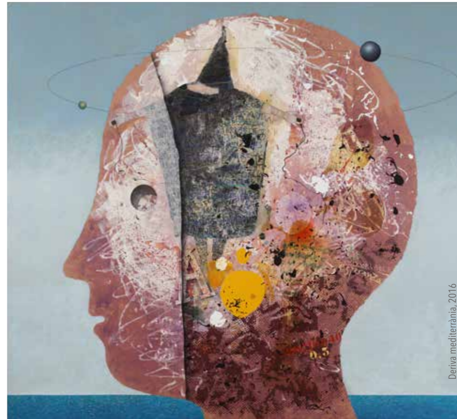
Deriva mediterrània, 2016