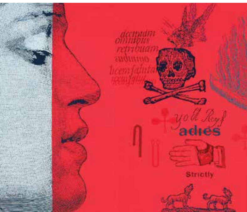
El sonido de tu huella. Detalle. Óleo sobre lienzo. 130 x 195 cm.

La tensión entre estas dos visiones, en Europa y en Latinoamérica, está presente y continuará en el futuro. Pero no puede negarse la presencia y la importancia creciente de la educación a lo largo de la vida en las agendas internacionales. Prestando atención, por ejemplo, a la sexta Conferencia Internacional de Educación de Adultos (CONFITEA VI), que acogió Belém (Brasil) en 2009, Emilia Prestes, se hizo eco de la relevancia de pasar de la retórica a la acción –uno de los lemas más recurrentes en la propia conferencia– y observó que resulta simple “establecer análisis y proyecciones sobre los aprendizajes de las personas jóvenes y adultas sin comprender el contexto sociopolítico y económico donde estas personas están insertas.” (Prestes, 2011: 250) (trad. propia). Un año después de esta VI Conferencia, en el Informe Mundial sobre el Aprendizaje y la Educación de Adultos (UNESCO, 2010) se pone el acento desde el primer capítulo a la educación de adultos en la perspectiva del aprendizaje a lo largo de la vida. “Actualmente tenemos un panorama de la educación de adultos y del aprendizaje a lo largo de toda la vida donde coexisten principios, políticas y prácticas diversos, con la evolución de sistemas abiertos y flexibles de oferta, capaces de adaptarse al cambio social