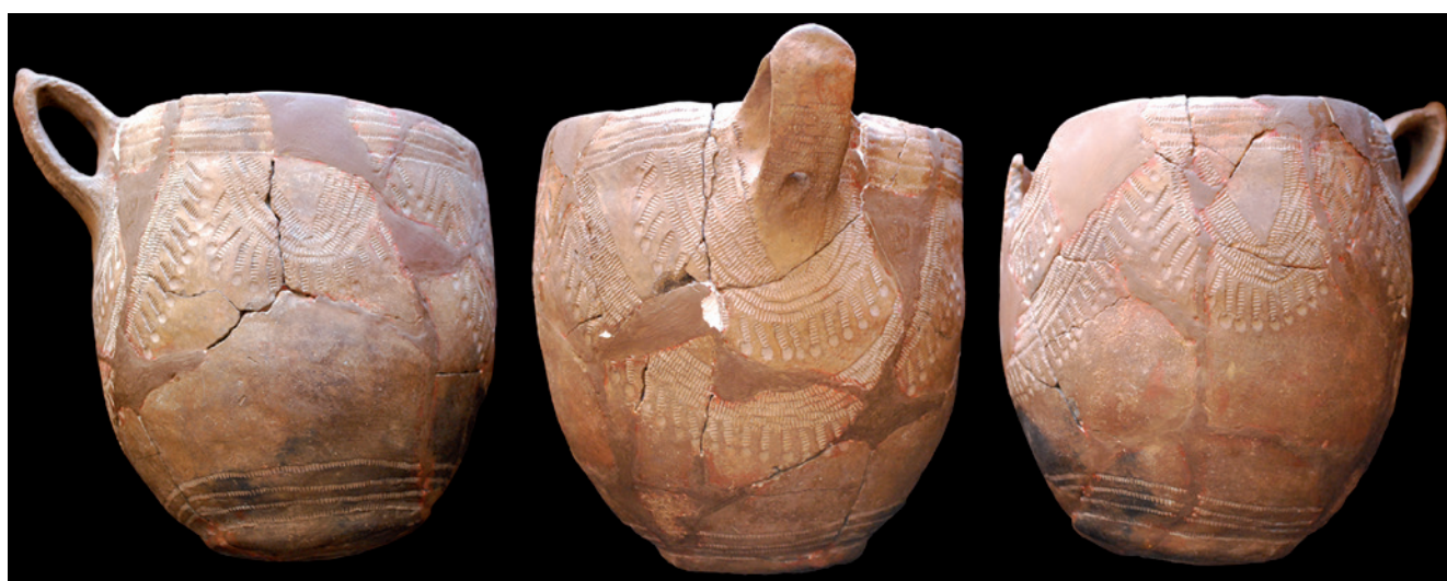
Fig. 2. Vaso cerámico decorado con la técnica de la impresión cardial encontrado junto a la inhumación doble de la Cova de la Sarsa.

Estas evidencias indican, al menos por ahora, que los contextos funerarios del cardial valenciano se componen de un número limitado de individuos, estando ausentes también las inhumaciones al aire libre. Los restos documentados hasta la fecha se han recuperado en cuevas de diferente morfología. En los huesos no se han identificado marcas antrópicas de proce-