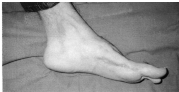
Figuras 5 y 6. Aspecto clínico a los 3 años de la lesión; se mantiene la longitud del primer radio y no se observa en el pie ningún signo indirecto de afección biomecánica.