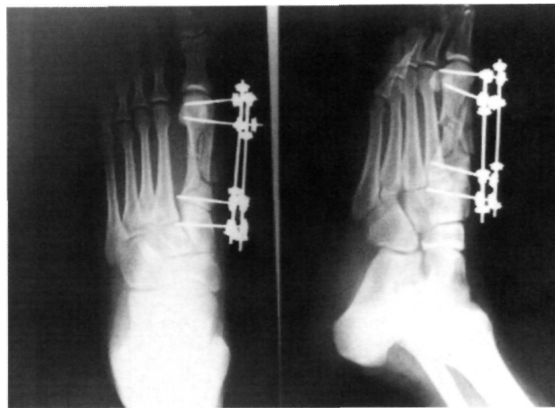
Figura 3. Osteosíntesis mediante fijador externo monolateral tipo OMS.

valgo, con efecto mínimo sobre la marcha (Fig. 4). Tres años después de la lesión el paciente se encuentra subjetivamente satisfecho, realiza asintomático cualquier tipo de actividad y no se observa en el pie ningún signo de trastorno biomecánico (Figs. 5 y 6).