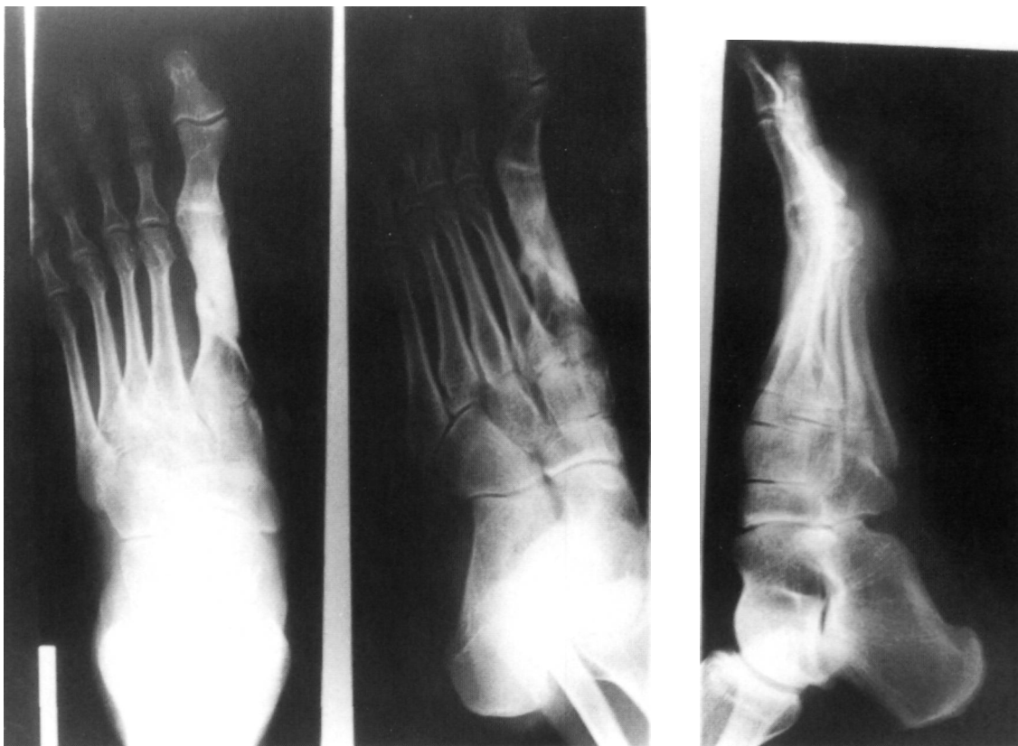
Figura 4. Radiografía a los 3 años de la lesión.

ras abiertas graves de cualquier localización (3). Shereff ha defendido la utilización de los fijadores externos para este tipo de fracturas (4). Con la utilización de un sistema de fijación externa monolateral conseguiremos, tras una buena reducción de la fractura, mantener la longitud del primer radio, no necesitando recurrir, en una fractura abierta como es el caso, al anclaje sobre huesos sanos vecinos (metatarsianos y cuñas) como ocurría con los clavos transfixiantes y agujas de Kirschner ni a la colocación directa en el foco de material extraño como pequeños tornillos o placas atornilladas o agu-