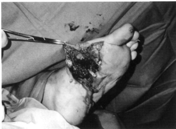
Figura 1. Varón de 20 años. Accidente de tráfico. Fractura abierta conminuta del primer metatarsiano. Aspecto clínico inicial con lesión ósea y gran afección de partes blandas.

ha fractura conminuta del primer metatarsiano con acortamiento de la longitud del misino (Fig. 2).