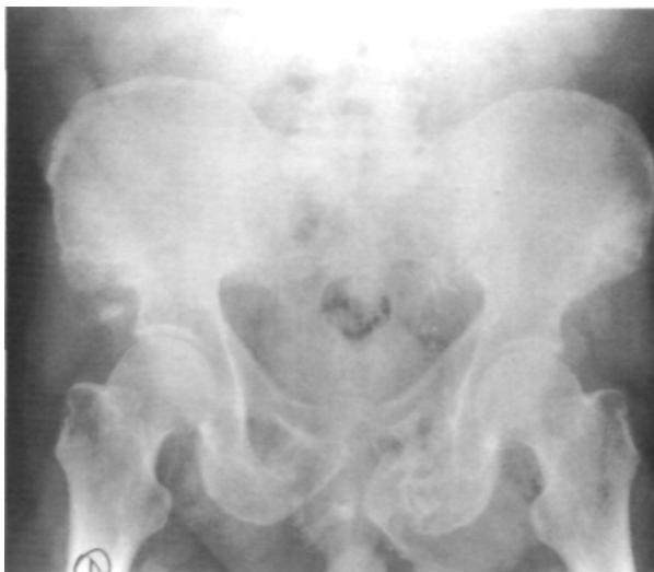
Figura 5. Resultado radiológico de la lesión ósea tras la retirada del fijador.

El shock hipovolémico del enfermo empezó a remontarse, pudiendo disminuir la utilización de