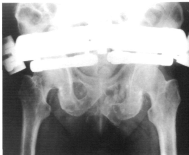
Figura 4. Se colocó un fijador externo con anclaje de los tornillos directamente en región supraacetabular, remitiendo el estado de shock y siendo intervenido de lesiones asociadas.

ferino. Se manipula la fractura y en el momento en que la pelvis aparezca más reducida se fijan los cabezales. No se busca una reducción anatómica, difícil de conseguir fundamentalmente en los casos de aplastamientos pélvicos; lo que se busca es una reducción lo más cercana a la normalidad posible que cierre espacios anatómicos dislacerados.