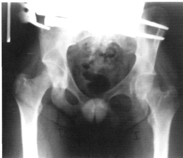
Figura 2. Reducción y estabilización de la lesión con la colocación de un fijador externo monolateral con anclaje de los tornillos a nivel de las crestas ilíacas.

una incisión de unos 4 cm. para la colocación de los tornillos controlando perfectamente las partes nobles vecinas, y sin que esto suponga convertir la técnica en abierta, ya que se actúa a distancia del foco de lesión. Comprobada mediante escopia la correcta colocación del primer tornillo, se coloca el segundo en la posición 4-5 del cabezal (2 anclajes con suficiente apoyo para la manipulación posterior de la pelvis) (Fig. 7). Se coloca luego el cabezal en T.