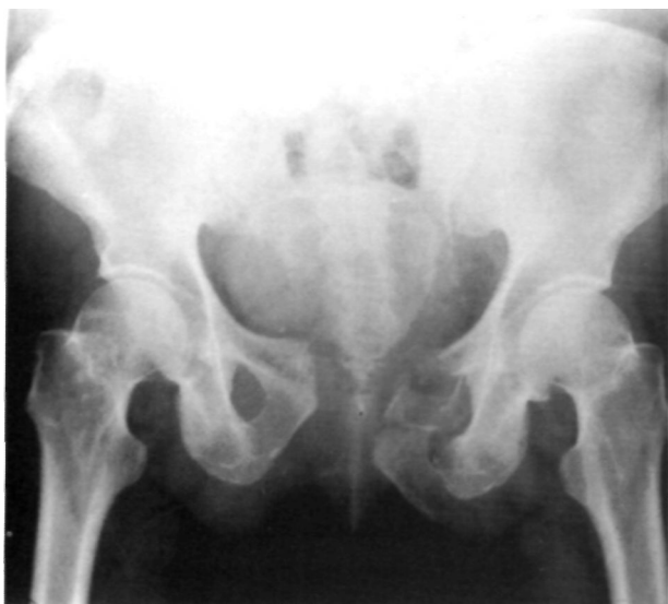
Figura 3. Varón, 58 años, accidente laboral con caída de altura. El paciente a su ingreso en urgencias mostraba shock hipovolémico y la radiología simple de la pelvis muestra esta lesión inestable.