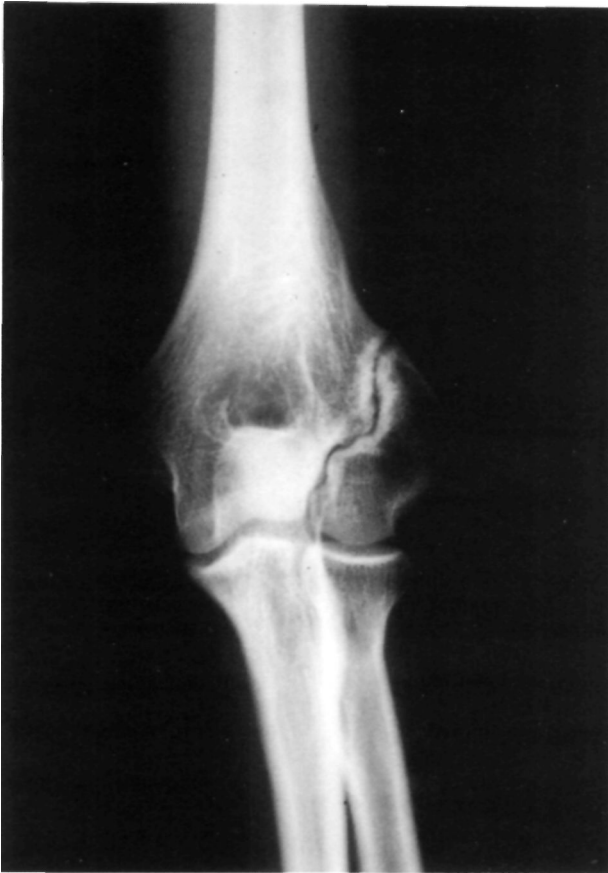
Figura 1. Caso n° 1. Imagen radiográfica anteroposterior de la pseudoartrosis del cóndilo humeral. La línea de pseudoartrosis transcurre desde la cortical externa hasta el límite externo de la tróclea humeral.

de consolidación. En controles radiológicos sucesivos se observó la presencia de un foco de pseudoartrosis sin desplazamiento de los fragmentos, por lo que se optó por una conducta expectante (Fig. 1). Después de realizar vida normal durante tres años, el paciente comenzó a presentar dolor localizado en el codo al realizar esfuerzos. Dada la persistencia de la imagen radiográfica de pseudoartrosis y las molestias referidas se optó por el tratamiento quirúrgico. Mediante un abordaje lateral del codo se colocaron dos tornillos de osteosíntesis a compresión en el foco de pseudoartrosis interponiendo en forma de puente un injerto óseo obtenido de ala ilíaca (Fig. 2). A los tres meses de la intervención el paciente había recuperado la movilidad completa del codo sin dolor al realizar esfuerzos. A los 6 meses es visible la perfecta unión ósea interfragmentaria (Fig. 3).