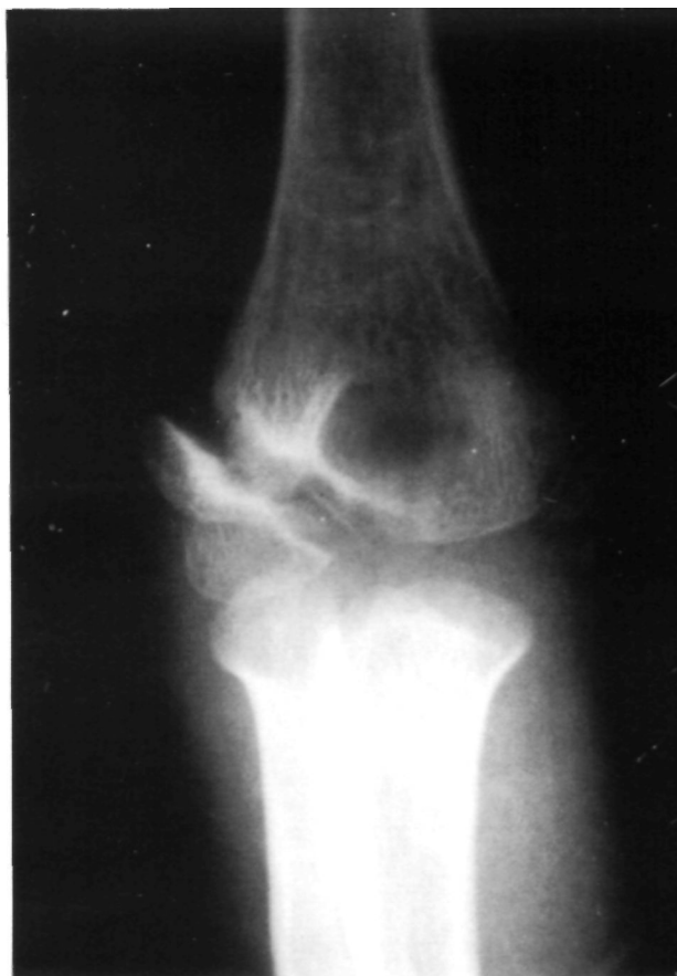
Figura 4. Caso n.º 2. Imagen radiográfica anteroposterior de la pseudoartrosis del cóndilo humeral. Después del intento de tratamiento ortopédico se observa un desplazamiento mayor de tres milímetros de los fragmentos.

el surco existente entre la tróclea y el capitellum (equivalente a una epifisiolisis tipo IV de Salter-Harris), manteniéndose la estabilidad entre la tróclea humeral y el cúbito. En el tipo 11 el trazo de fractura parte de la metáfisis pasando por el cartílago fisario del cóndilo sin atravesarlo, para terminar en el vértice de la tróclea (equivalente a una epifisiolisis tipo 11 de Salter-Harris), lo cual puede producir una inestabilidad en valgo del codo al desplazarse externamente el cúbito. Según el desplazamiento inicial de la fractura pueden ser divididas en estadios: Estadio I. Fractura incompleta sin desplazamiento. Estadio II. Fractura completa con desplazamiento lateral mayor de 2 mm. Estadio III. Fractura con desplazamiento rotacional (14). En base a esta clasificación, las fracturas en estadio 1 no tienen riesgo de desplazamiento por lo que pueden ser tratadas en forma conservadora mediante un vendaje enyesado colocando el codo en flexión de 90° y pronosupinación neutra (1-3). Sin embargo, las fracturas en estadio II y III son susceptibles de sufrir desplazamiento secundarios, por lo que una reducción perfecta puede acompa-