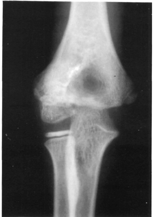
Figura 6. Caso n.º 2. Resultado final una vez retirada la osteosíntesis. Se observa la consolidación del foco y la restitución de las relaciones anatómicas normales.

latura supinadora ejerce una fuerza distractora sobre el foco de fractura y, en segundo lugar, existe un elevado riesgo de compromiso vascular en el fragmento metafisario, siendo ésta la única zona por donde penetra la vascularización al cóndilo. Esta característica vascularización del cóndilo humeral es importante también en el abordaje quirúrgico, ya que se ha descrito la necrosis isquémica del cóndilo como complicación de la exposición quirúrgica (13). También se ha propuesto como causa directa del retardo de consolidación el líquido articular del codo que penetrando en la fractura inhibe la formación del coágulo de fibrina y por lo tanto su progresión hasta callo óseo (7, 10). En ambos casos se siguió la técnica injerto óseo y osteosíntesis con tornillos y/o agujas de Kirschner descrita por Flynn en 1989 (8).