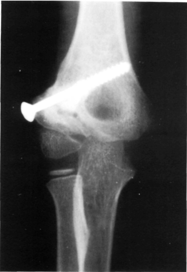
Figura 5. Caso n.º 2. Imagen radiográfica de la osteosíntesis a compresión después de resecar el tejido fibroso interpuesto en el foco de pseudoartrosis.