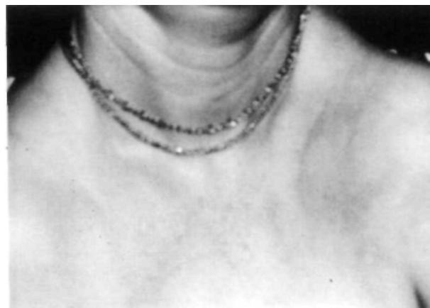
Figura 4. Aspecto clínico correspondiente al defecto clavicular en la madre.

muestra un paciente de raza negra, que tras sufrir una fractura de húmero, casualmente se le descubre una P.C.B.C.