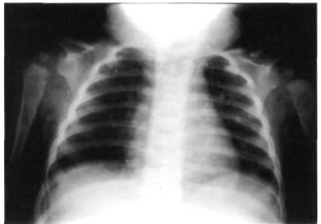
Figura 1. Radiografía anteroposterior de ambos hombros donde se observa el defecto óseo a nivel del tercio medio de ambas clavículas en la niña.

ción cefálica, con un Test de Apgar de 9/10, pesa 3700 gramos (percentil 95), talla 51 cm., que durante las primeras semanas se detecta una imagen radiológica de defecto óseo clavicular bilateral, con desviación de fragmentos, simétricos, sin callo de fractura, ni tumefacción, ni dolor a dicho nivel y movilidad de extremidades superiores habitual para su edad. No presenta imágenes de displasia acetabular, ni dextrocardia, ni disostosis craneo-