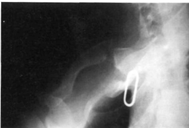
Figura 1. Proyección inferosuperior de clavícula. Imagen preoperatoria. Fractura Bipolar de Clavícula.

Las luxaciones y fracturas-luxaciones que afectan a ambos extremos de la clavícula no son frecuentes. Se han descrito anteriormente lesiones complejas de la clavícula incluyendo luxación bipolar y hasta fractura del tercio medio acompañada de luxación de la articulación acromioclavicular y subluxación de la esternoclavicular, pero la entidad que nosotros describimos es distinta a las anteriormente presentadas. Comunicamos un caso en el